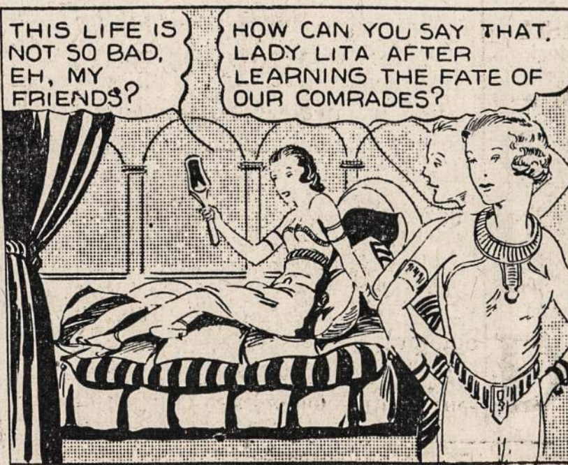
THIS LIFE IS NOT SO BAD, EH, MY FRIENDS?