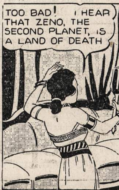
TOO BAD! I HEAR THAT ZENO, THE SECOND PLANET, IS A LAND OF DEATH