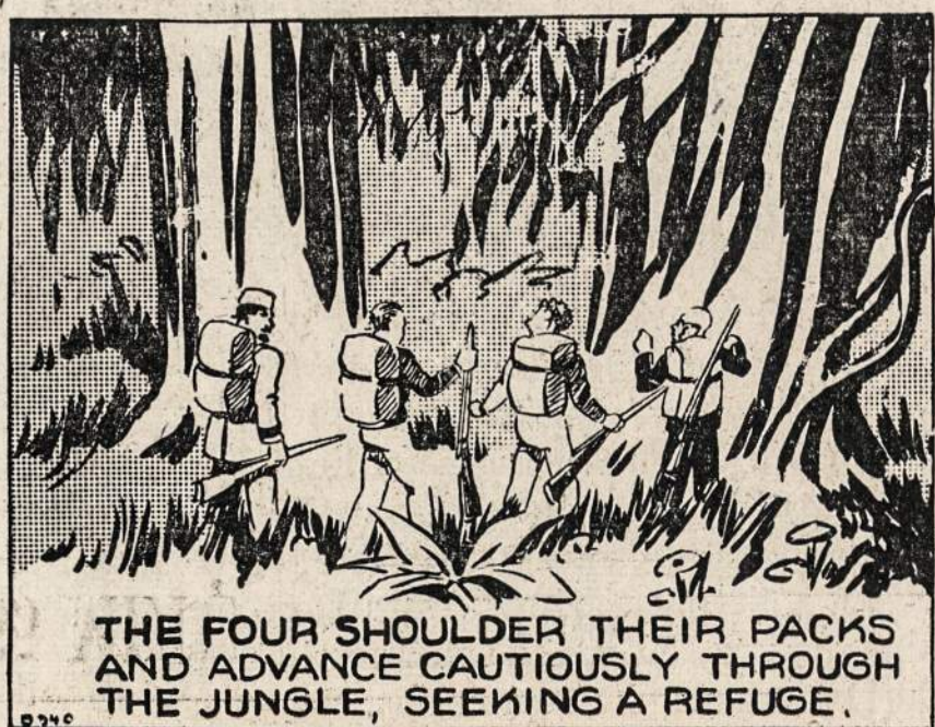
THE FOUR SHOULDER THEIR PACKS AND ADVANCE CAUTIOUSLY THROUGH THE JUNGLE, SEEKING A REFUGE.