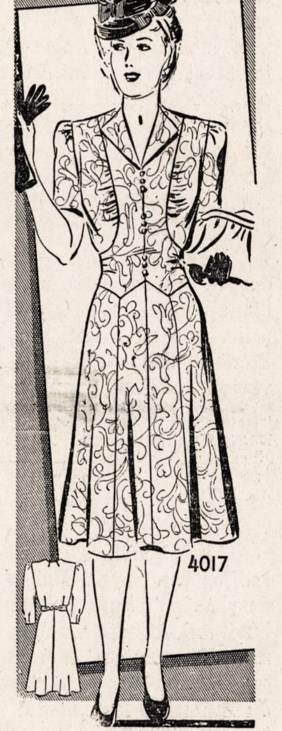
No. 4017 — Graži laibinanti suknelė. Mieros 34, 36, 38, 40, 42, 44, 46 ir 48.

Norint gauti vieną ar daugiau virš nurodytų pavyzdžių prašome iškirpti paduotą blankutę arba priduoti pavyzdžio numerį pažymėti mierą ir aiškiai parašyti savo vardą pavardę ir adresą. Kiekvieno pavyzdžio kaina 15 centų. Galite pasiųsti pinigais arba pašto ženkleliais kartu su užsakyimu. Laiškus reikia adresuoti: Naujienos Pattern Dept., 1739 So. Halsted St., Chicago, Ill.