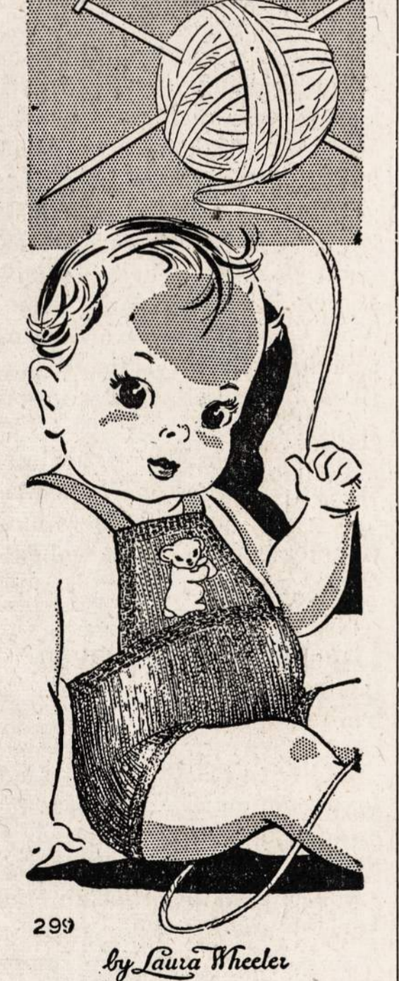
No. 299 — Nertas kūdikio "sunsuit".

NAUJIENOS NEEDLECRAFT DEPARTMENT 1739 S. Halsted St., Chicago, Ill. No. 299 Čia įdedu 11c. ir prašau atsiųsti man aukščiausią pažymėtą numerį (pavyzdžius 10c., prisiumtomas 1c., viso—11c.) _____ Vardas ir pavardė. _____ Adresas _____ Miestas _____ Valstija