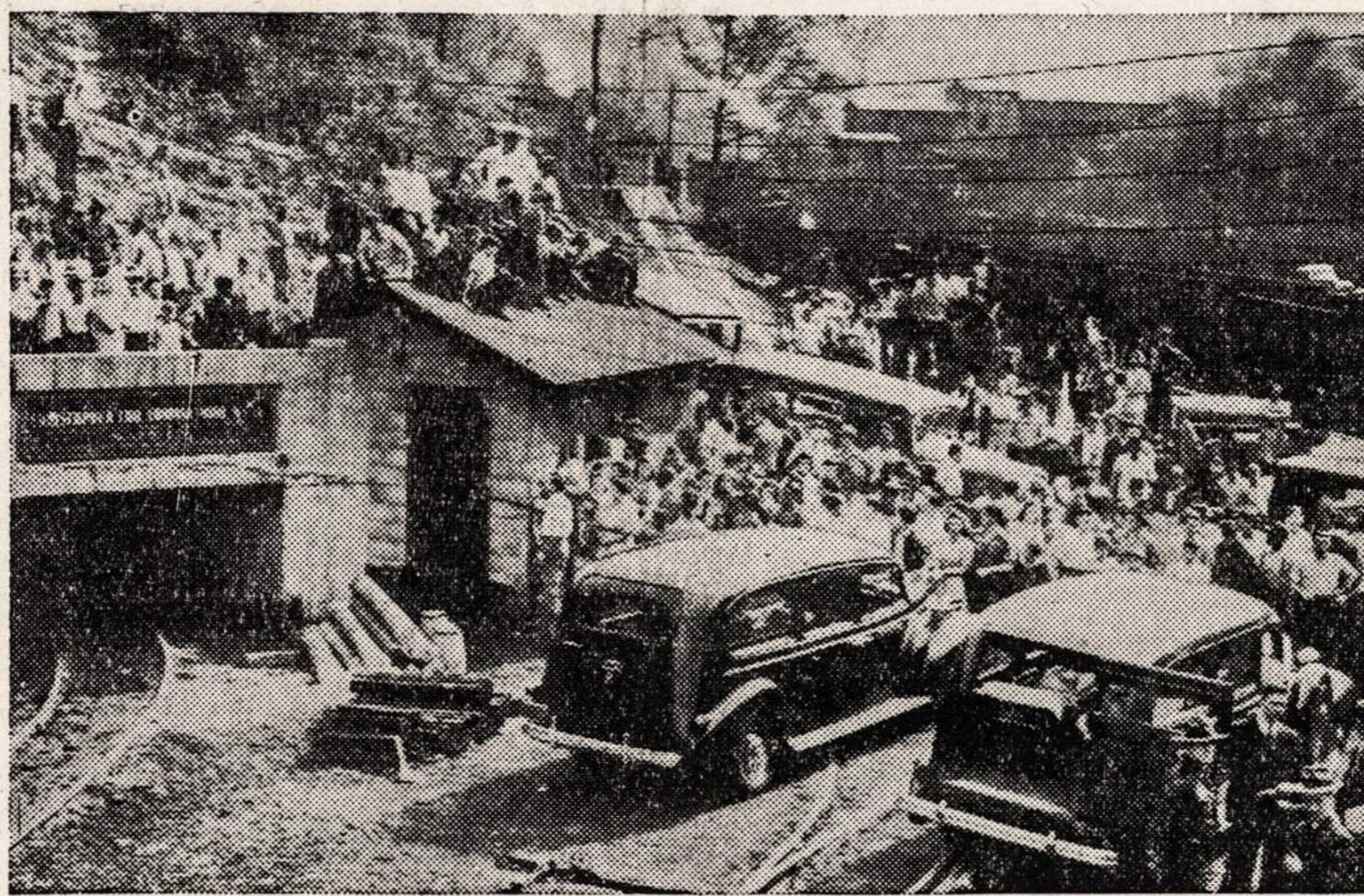
Giminės ir draugai susirinkę prie kasyklos žiočių Osage, aukia 54 angliakasių lavonų iškėlimo. Darbininkai žuvo kasyklos sprogime.