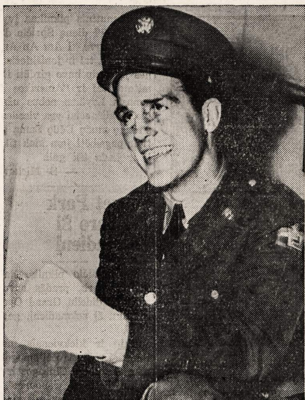
Kareivis Billy Conn, žymus Amerikos boksininkas, rodo aprištą ranką po to, kai New Yorko daktarai atrado, jog riešo kaušas laužtas. Conn susizeidė muštyne su uošviu.