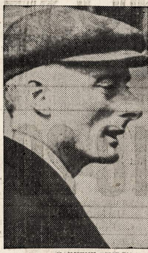
NAUJIENŲ AGENTŲ FOTOFOTODARBEJIMAI Bedford kunigaikštis, 54 metų amžiaus, kuris lordų rumuose gynė Hitlerio režimą.