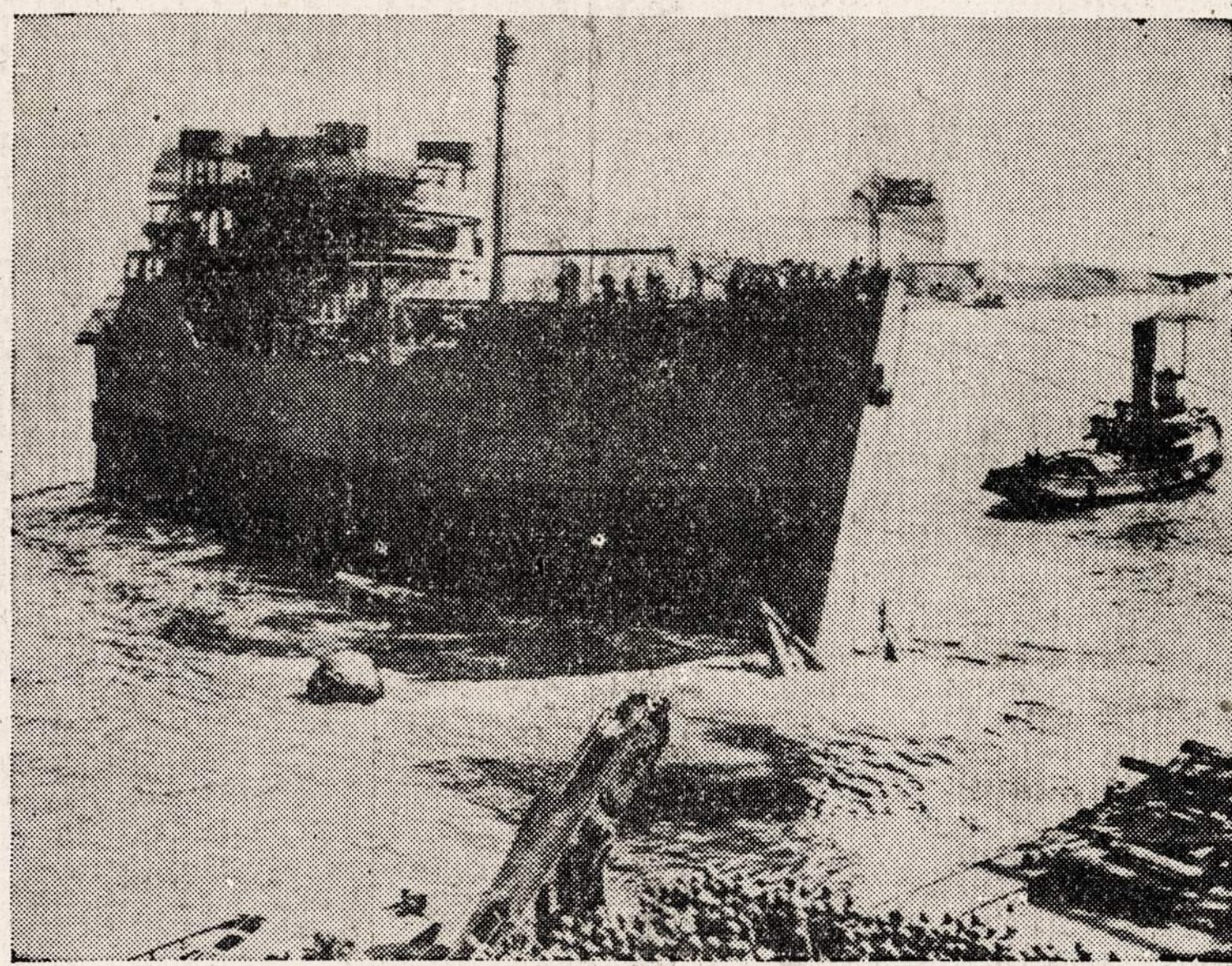
Anglijos laivų dirbtuvėse nuleista vandenin pusė laivo. Ji bus pridurta prie kitos pusės, pasilikusios po to, kai laivas atsimušė į miną.