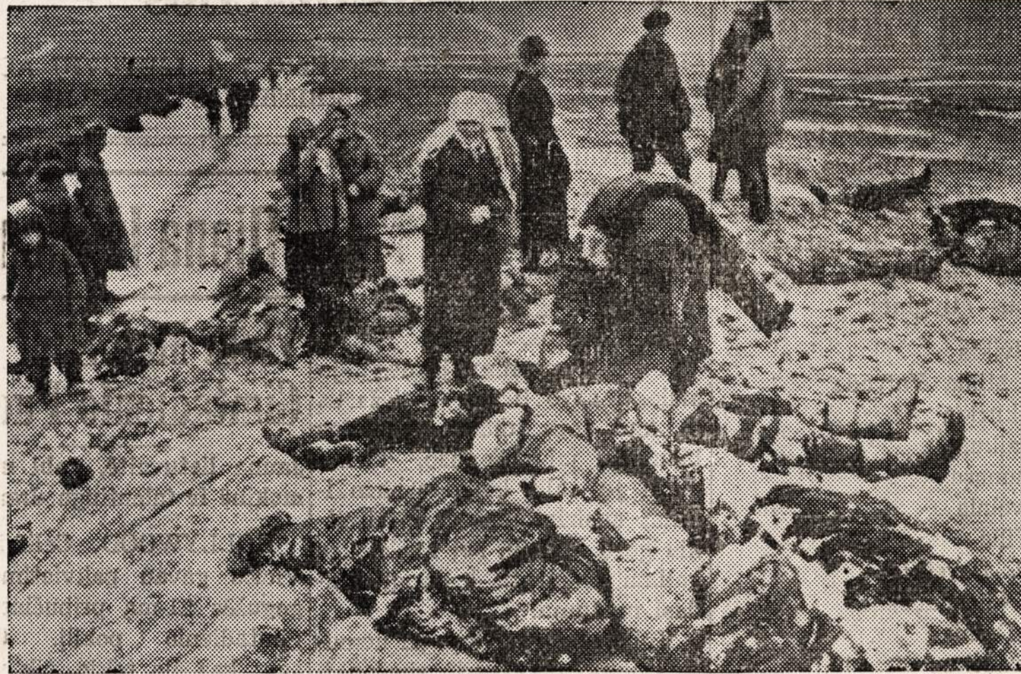
Raudančios rusės, sugrįžę į savo vietovę po to, kai rusų kariai naciūs išstūmė, kruvoje lavonų ieško savųjų vyrų.