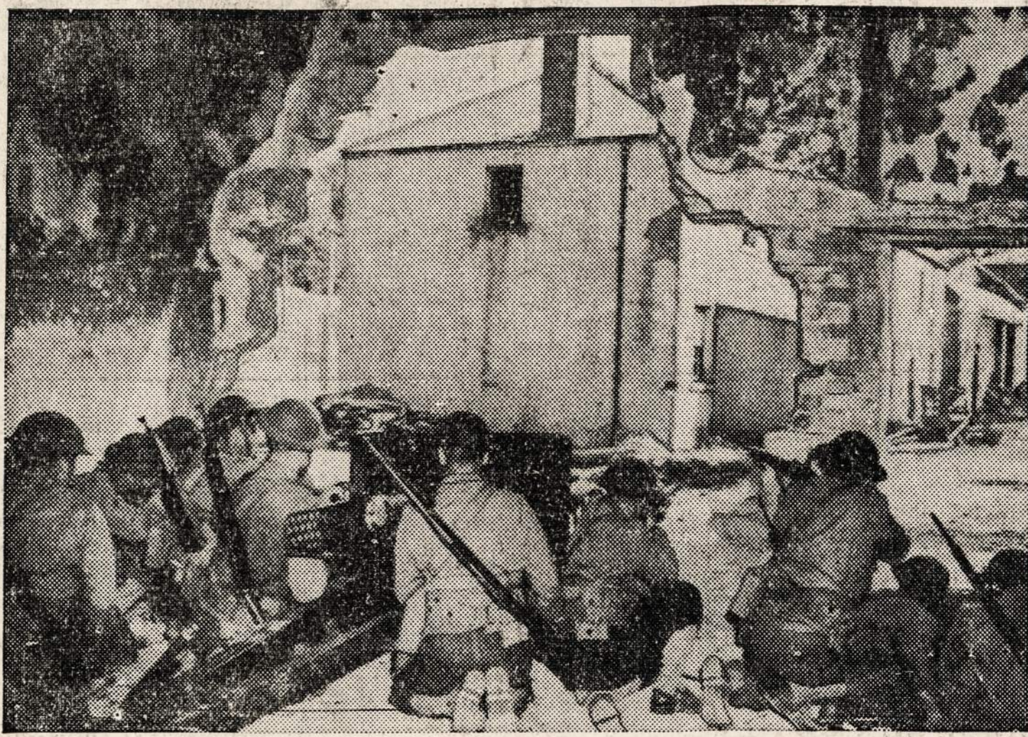
Amerikiečiai kariai Airijoje lavinas kariavimui.