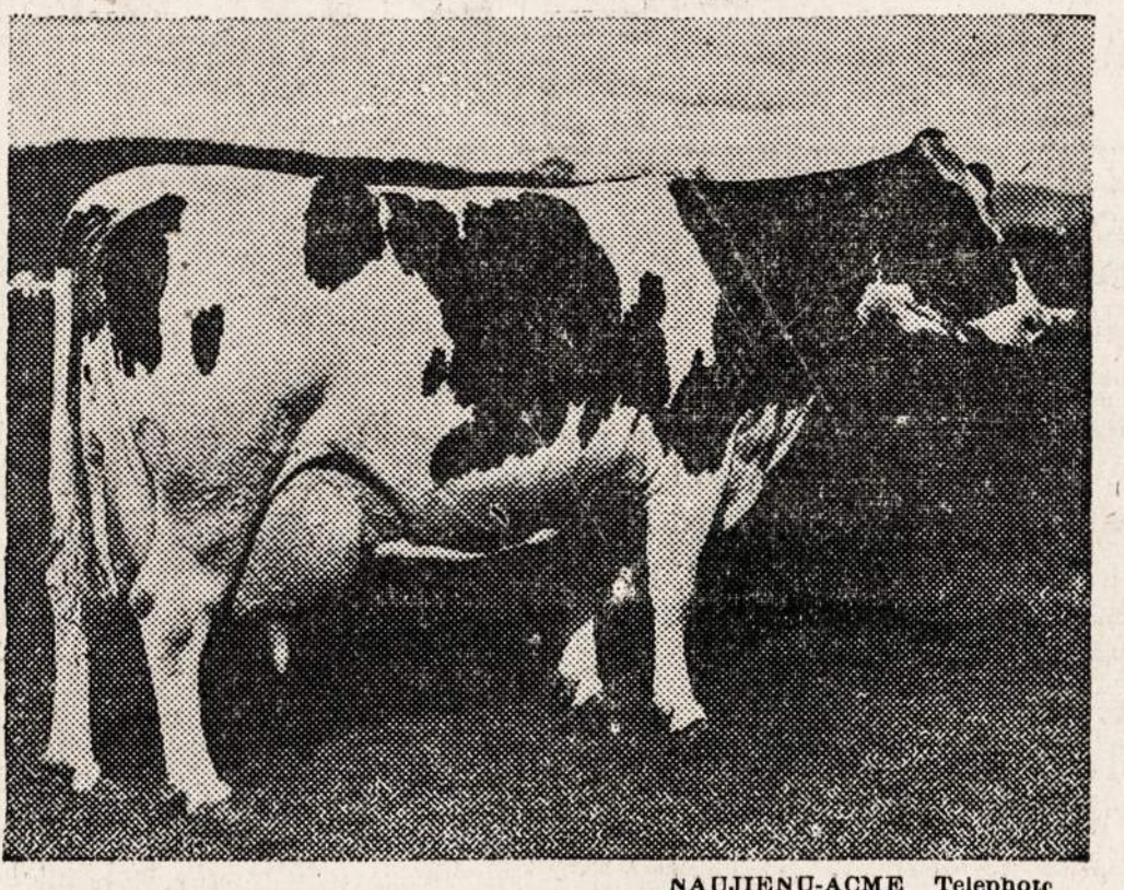
Ši karvė pripažinta pieningiausia visam pasauly. Metų bėgy ji davė 41,943.4 svarus pieno. Išėina šerėk po 50 kvortų į dieną. Tai bent produktingumas.