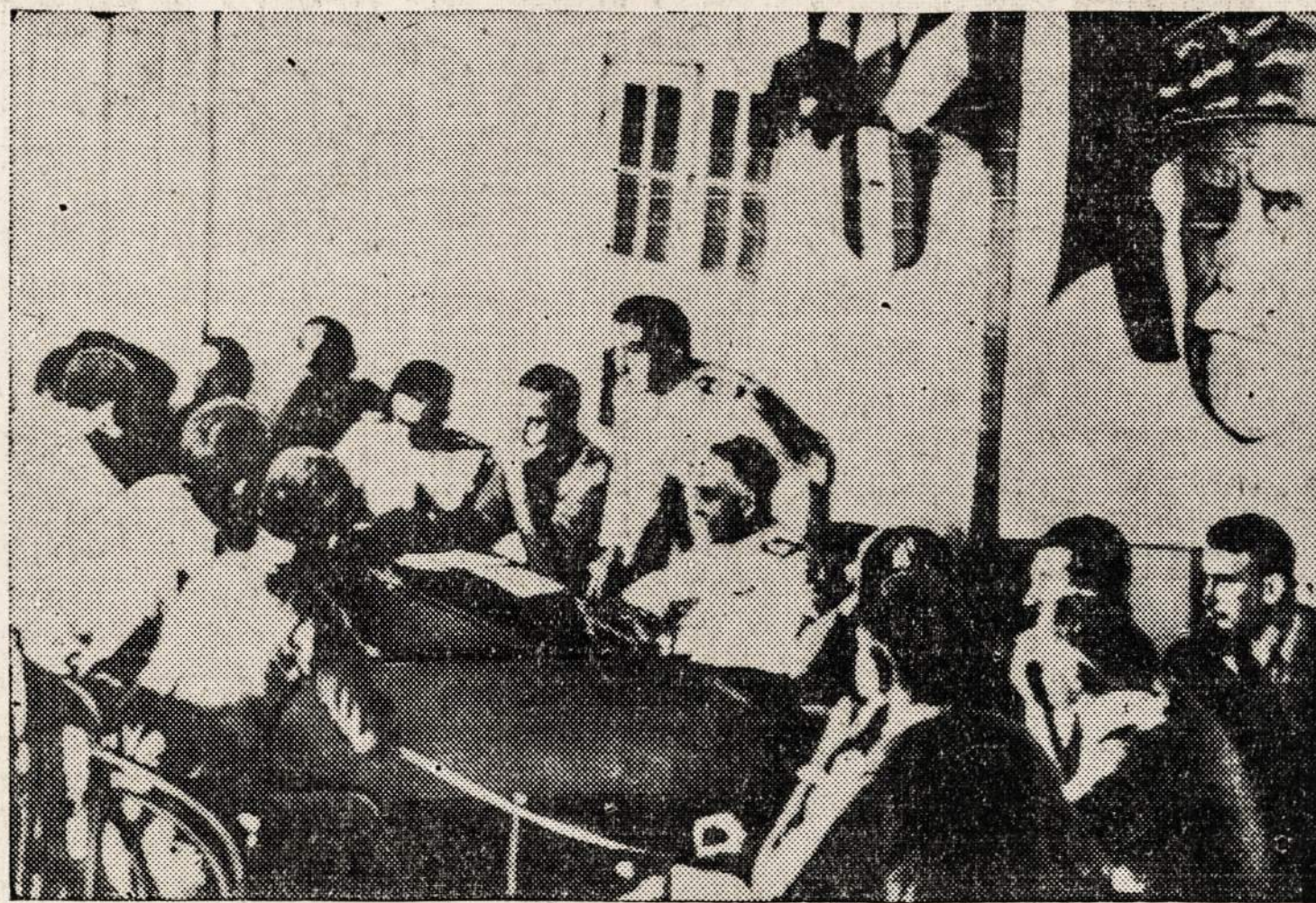
Ši per radiją iš Londono gauta fotografija parodo prancūzų laivyno ir armijos atstovus Madigaskare pasiduodančius anglams.