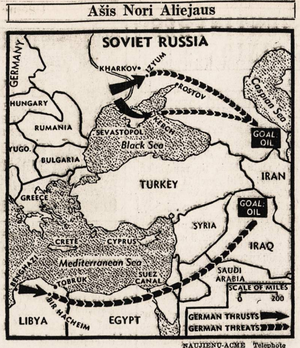
Dabartinės Ašies ofensyvos Rusijoje ir Libijoje matomai siekia vieno ir to paties — įsigauti į Artimuosius Rytus, kur Sąjungininkai semia reikalingąją karo mašinai aliejų.

Bet tie laikai jau seniai praėjo. Hitleris laipsniškai pakeitė armijos vadovybės sąstatą, pašalinamas iš jos nepalankius jam senųjų "junkerių" (dvarininkų) atstovus ir į jų vietas pastatydamas aklaus savo pakalikus. Jam nereikėjo elgtis su savo generolais, kaip Stalinas bandė pasielgti su Tuchačevskiu, Egorovu, Putna, Uborevičium ir kitais. Bet savo tikslą jisai vistiek pasiekė: "partija nugalėjo armiją"! Kitaip sakant, Hitleris pasirodė galingesnis už "reichswehro" generalinį štabą. Šiandien vyriausias vokiečių armijos vadas yra ne gen. Brauchičas, o nacių "fiureris". Galimas daiktas, kad Brauchičas yra ir suimtas, jeigu jisai drįso "murmėti" prieš Hitlerį. Hitleris dabar Vokietijoje yra viskas: nacių "saulė".