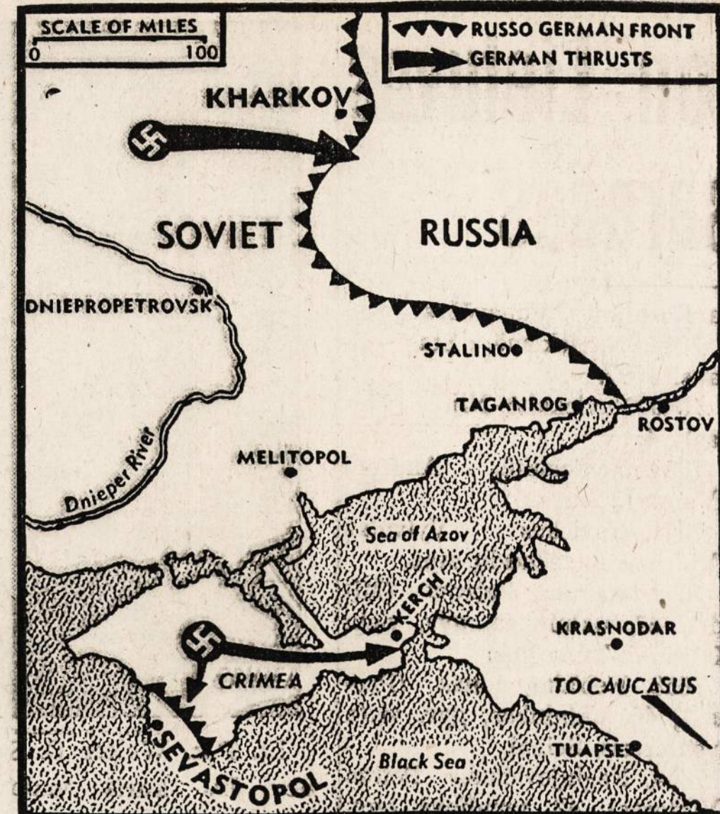
Naciai pradėjo ofensyvą dviejose vietose: Kryme prieš Sevastopolio uosto ir Charkovo srityje.

Bolševikams truksta geros valios. Todėl demokratijos turi būti sargyboje.