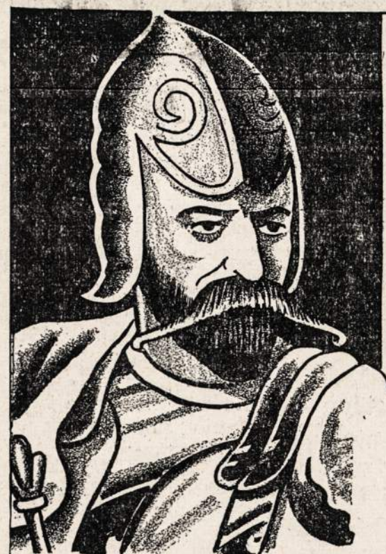
GRAND DUKE GEDIMINAS (1316-1341) THE TRUE FOUNDER OF THE POWERFUL GRAND DUCHY. FOUNDED VILNIUS IN 1323 AND MADE IT HIS CAPITOL

Tai yra puiki knyga, išleista Švyturio Bendrovės. Šioje istorinėje knygoje yra virš 200 paveikslų. Kiekvienas lietuvis vykdamas atostogų, turėtų pasiimti su savim šią knygą. Turėdamas liuso laiko perskaityti ir pasigėrėti paveikslais. Perskaitęs šią knygą, turės didelę dvasinę naudą.