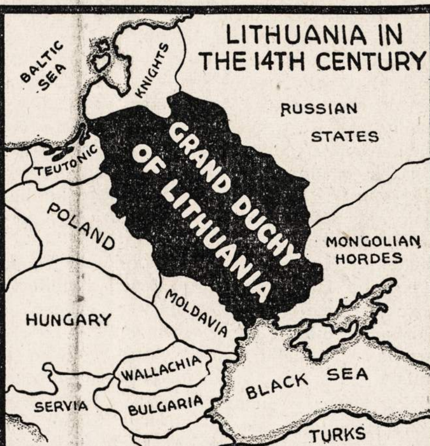
LITHUANIA IN THE 14TH CENTURY ALGIRDAS, IN A WAR AGAINST NOVGOROD THE GREAT, RAVAGED RUSS TERRITORY AND LITHUANIA SPREAD TO THE BLACK SEA. IN 1368 HE COMPLETELY DESTROYED THE MONGOL ARMIES ON THE LOWER DNEIPER