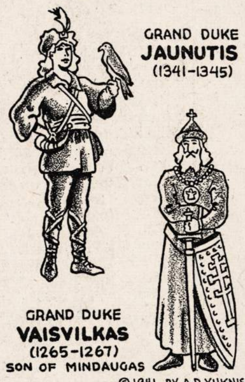
GRAND DUKE JAUNUTIS (1341-1345) GRAND DUKE VAISVILKAS (1265-1267) SON OF MINDAUGAS