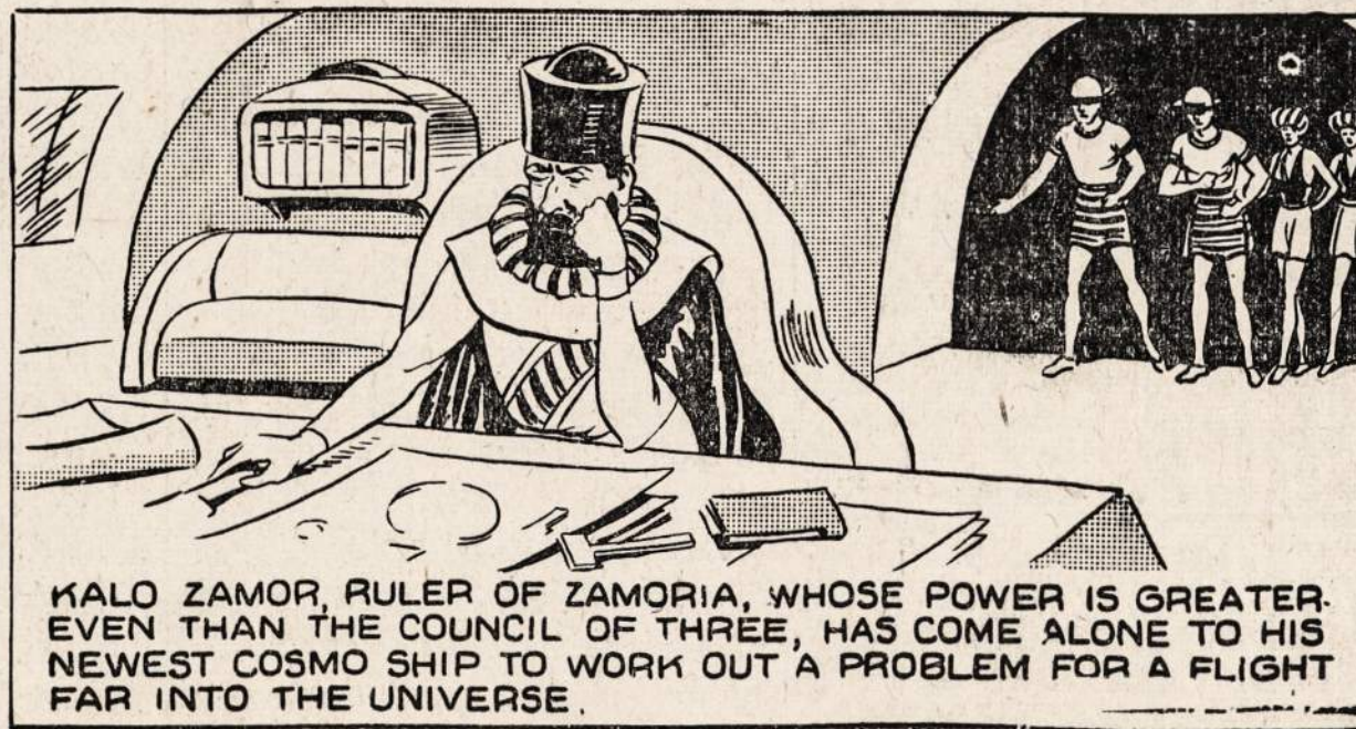
KALO ZAMOR, RULER OF ZAMORIA, WHOSE POWER IS GREATER EVEN THAN THE COUNCIL OF THREE, HAS COME ALONE TO HIS NEWEST COSMO SHIP TO WORK OUT A PROBLEM FOR A FLIGHT FAR INTO THE UNIVERSE.