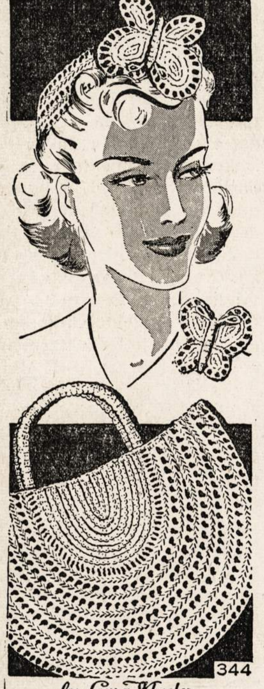
No. 344 — Megsti papušalai.

NAUJIENOS NEEDLECRAFT DEPARTMENT 1739 S. Halsted St., Chicago, Ill.