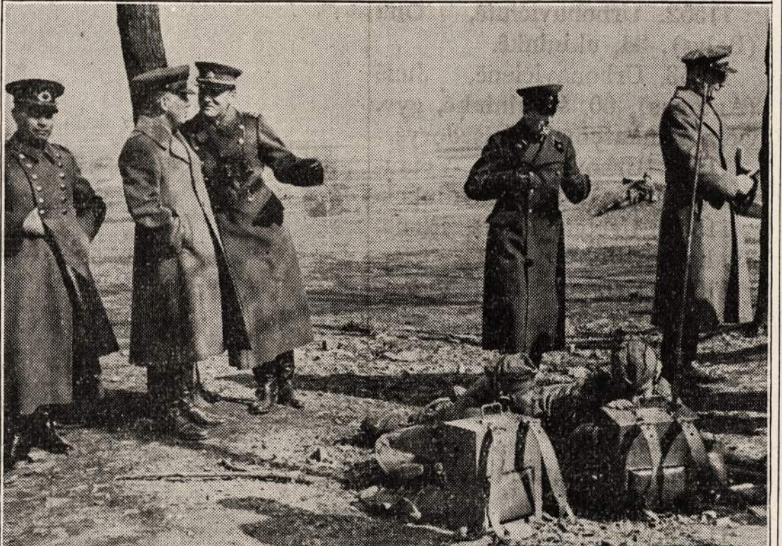
1940 M. BALANDIS MENUO.

Mane ir rusus išskyrus, mūsų grupę sudarė daugumokai, tame skaičiuje ir amerikiečiai.