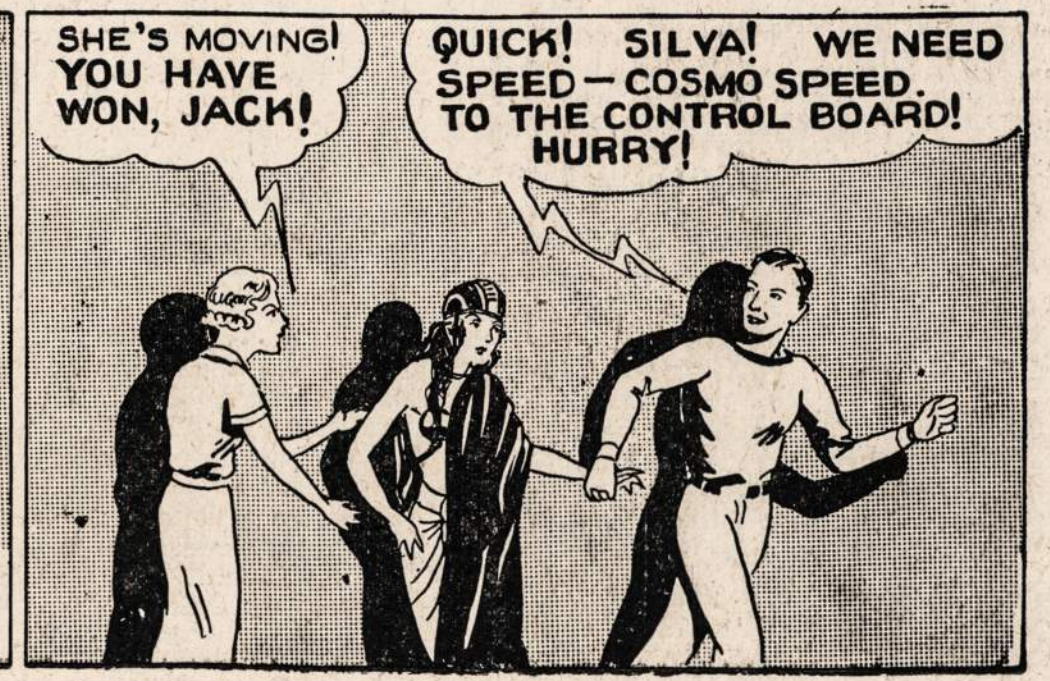
SHE'S MOVING! YOU HAVE WON, JACK! QUICK! SILVA! WE NEED SPEED — COSMO SPEED. TO THE CONTROL BOARD! HURRY!