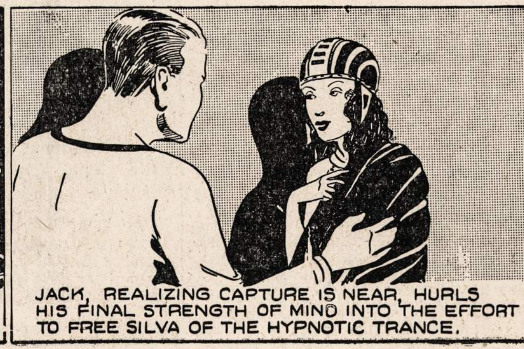
JACK, REALIZING CAPTURE IS NEAR, HURLS HIS FINAL STRENGTH OF MIND INTO THE EFFORT TO FREE SILVA OF THE HYPNOTIC TRANCE.