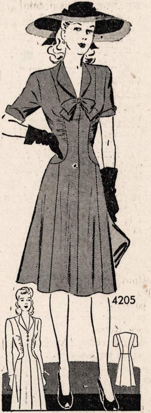
4205—Graži išeiginė suknelė ypac tinkama rudeniu. Sukirptos mieros 12, 14, 16, 18 ir 20.

Norint gauti vieną ar daugiau virš nurodytų pavyzdžių prašome iškirti paduotą blankutę arba priduoti pavyzdžio numerį pažymėti mierą ir aiškiai parašyti savo vardą pavardę ir adresą. Kiekvieno pavyzdžio kaina 15 centų. Galite pasūsti pinigų arba pašto ženkliais kartu su užsakyumu. Laiškus reikia adresuoti: Naujienos Pattern Dept., 1739 So. Halsted St., Chicago, Ill.