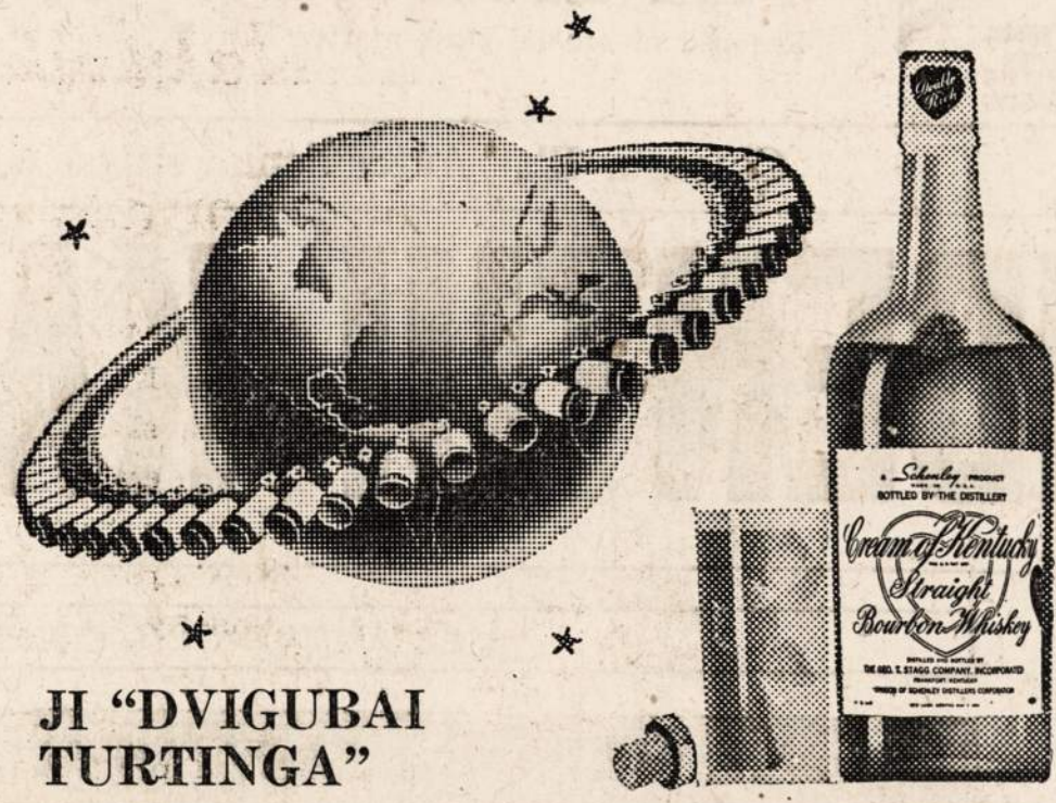
Ji "DVIGUBAI TURTINGA"