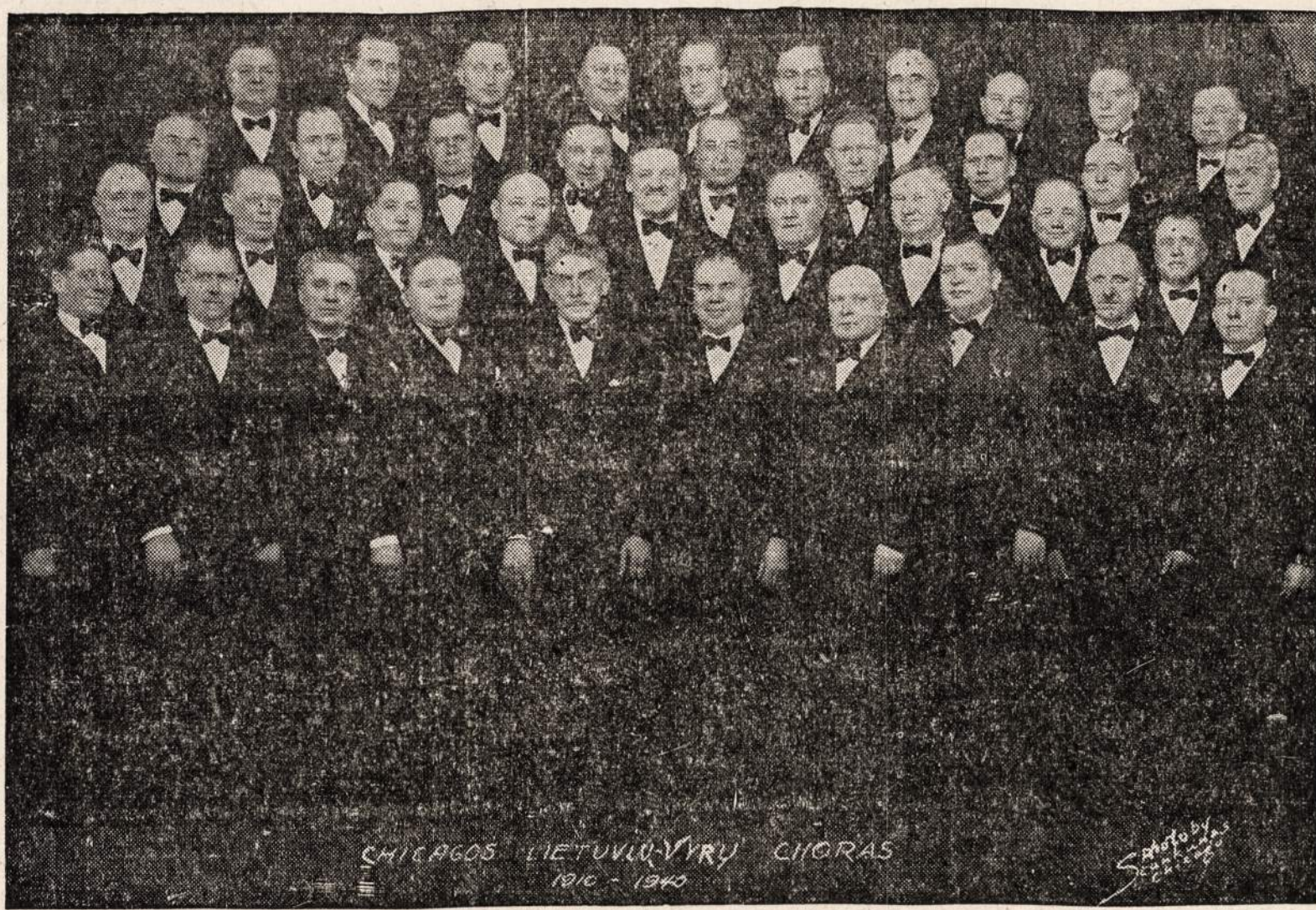
Chicago Vyrų Choras

Akimirkiai prabėgo vasara. Paukščiai apleidžia vasarvietes. girios geltonuoja ir lapai krinta. Užsibaigė atostogos ir visi grįžta prie savo nuolatinio darbo.