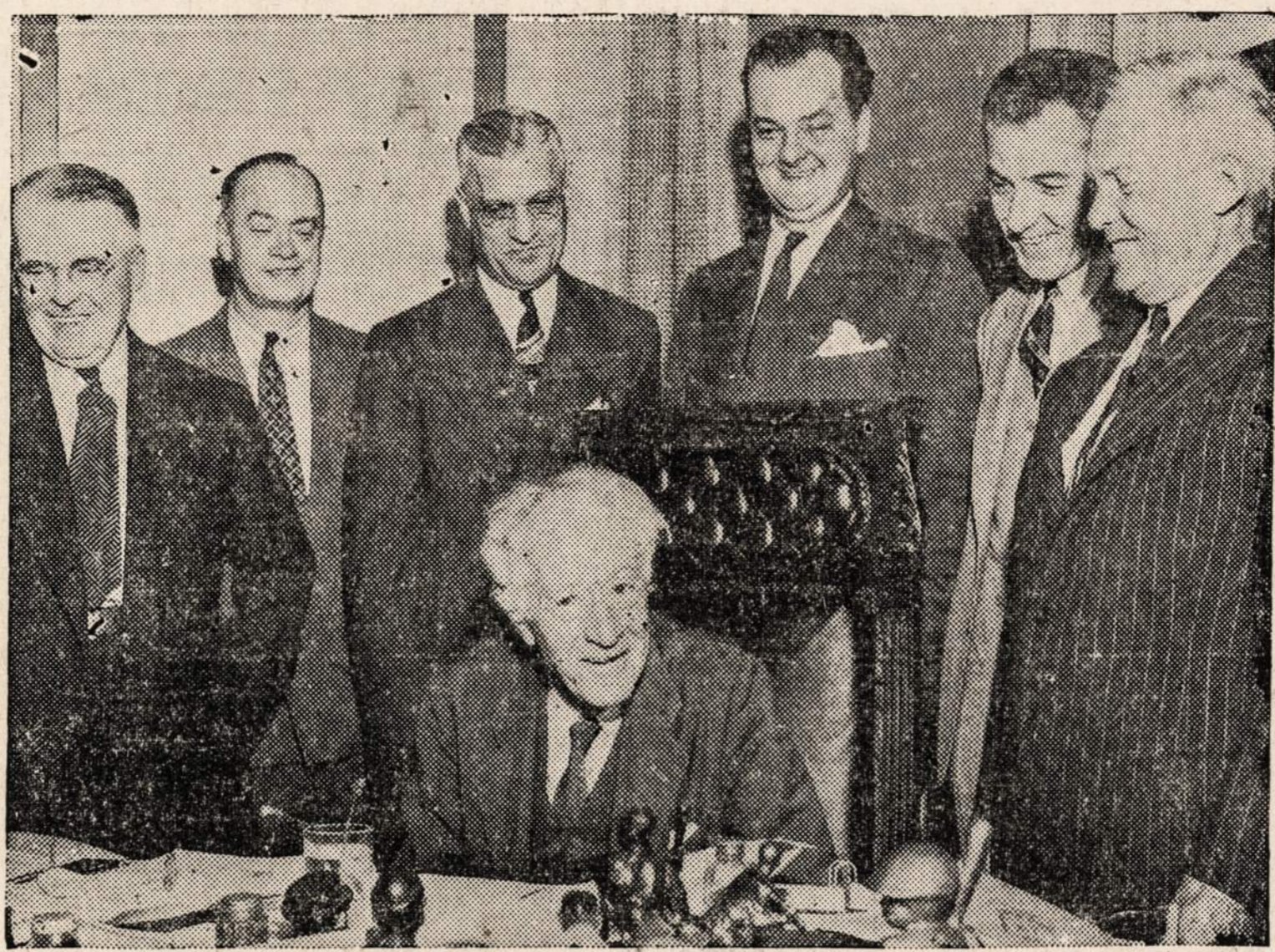
Beisbolo komisinerius K. M. Landiš, (sėdi) tariasi su beisbolo lygos ir klubo pareigūnais Chicagoje.

Automobilių klubai ir policija nori, kad būtų išleistas Chicago miestui, Cook kauntei ir visai Illinois valstijai įstatymas, kurs nusakytų automobiliams važiuoti ne greičiau, kaip 35 mylias per valanda.