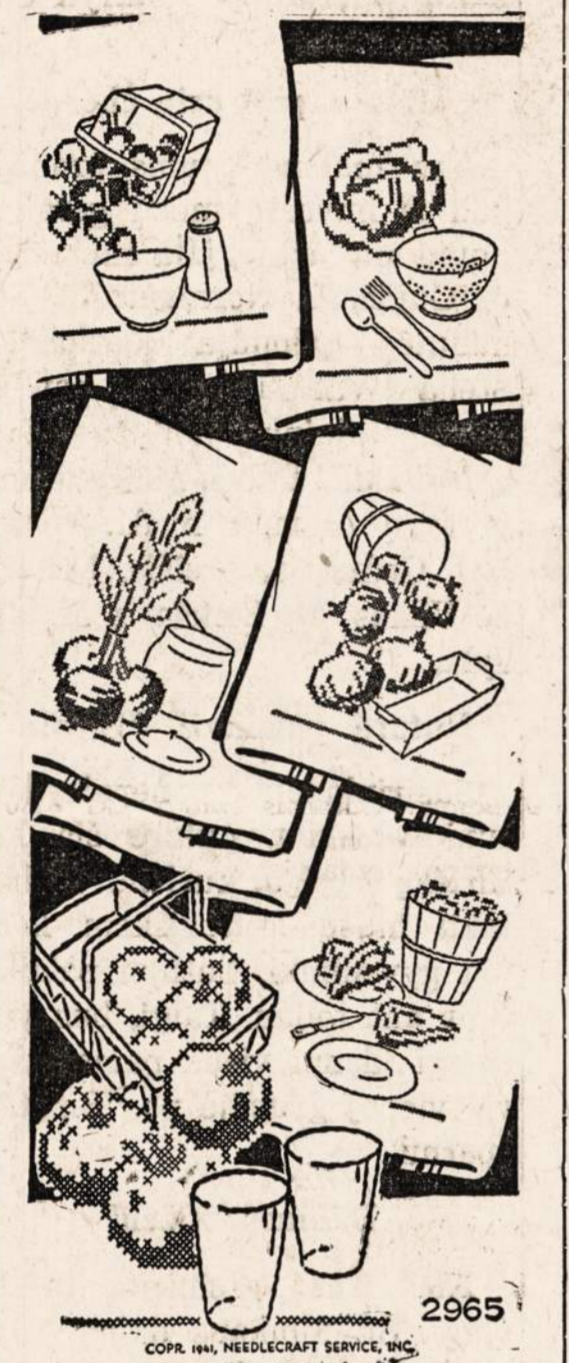
2965 CORP. INC. MEDICAL SERVICE, INC. by Laura Wheeler

Saugokitės meno spekuliantų ir šarlatanų, kurie visai nėra jokie pedagogai ir kurie pastoja kelią jūsų vaikams tapti pasauliniais virtuozais — koncertantais, kurie būtų mūsų tautos pažybojis tarptautinėje arenoje.