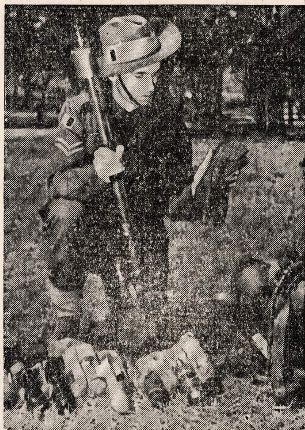
Australijos karys apžiūri iš japonų atimtą prietaisą Milne užlajoje. Laiko jis rankoje prietaisą ugniai meti ir specialų batą. Tokius batus dėvi japonai su deformuotomis kojomis.