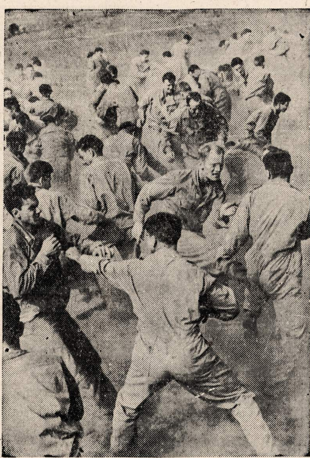
FORT MEADE, Md. — Amerikos kareiviai lavinami invazijai "Ranger and Comb" mokykloje.