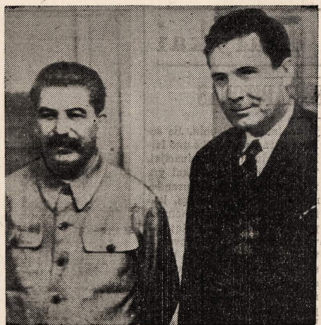
Wendell Willkie (po dešinei) laiko konferenciją su Stalinu Maskvoje kaip prezidento Roosevelto specialis pasiuntinys.

Šiandien sovietų Rusija bando tą subankrotavusią idėją panaudoti savo tikslams, atsukdamai ją prieš vokiečius. Maskva sako, kad reikia užkirsti kelią vokiečiams į rytus - ir "todėl" Pabaltijo kraštai turį priklausyti rusams. Lietuvai grėsia pavojus.