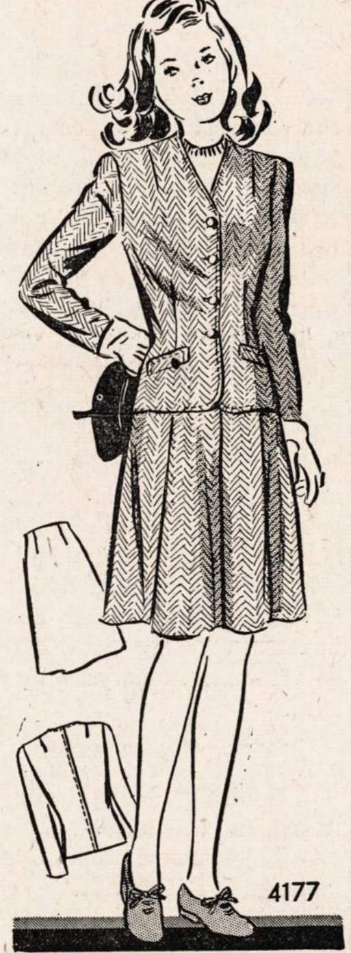
No. 4177 — Gražus dviejų šmotų kostiumas. Ypač praktiškas mokyklon einančiai mergaitei. Sukirptos mieros 10, 12, 14 ir 16.