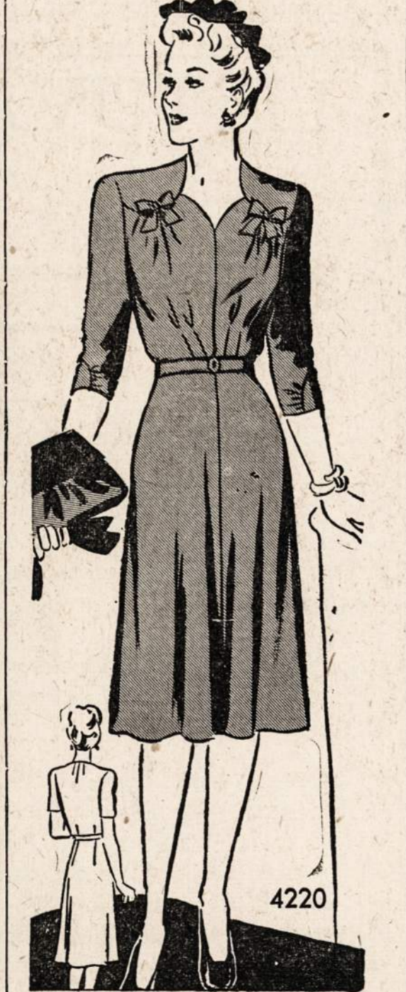
No. 4220 — Graži išėiginė suknelė. Sukirptos mieros 34, 36, 38, 40, 42, 44 ir 46.

Norint gauti vieną ar daugiau virš nurodytų pavyzdžių prašome iškirpti paduotą blankutę arba priduoti pavyzdžio numerį pažymėti mierą ir aiškiai parašyti savo vardą pavardę ir adresą. Kiekvieno pavyzdžio kaina 15 centų. Galite pasiųsti pinigų arba pašto ženkleliais kartu su užsakyimu. Laiškus reikia adresuoti: Naujienuos Pattern Dept., 1739 So. Halsted St., Chicago, Ill.