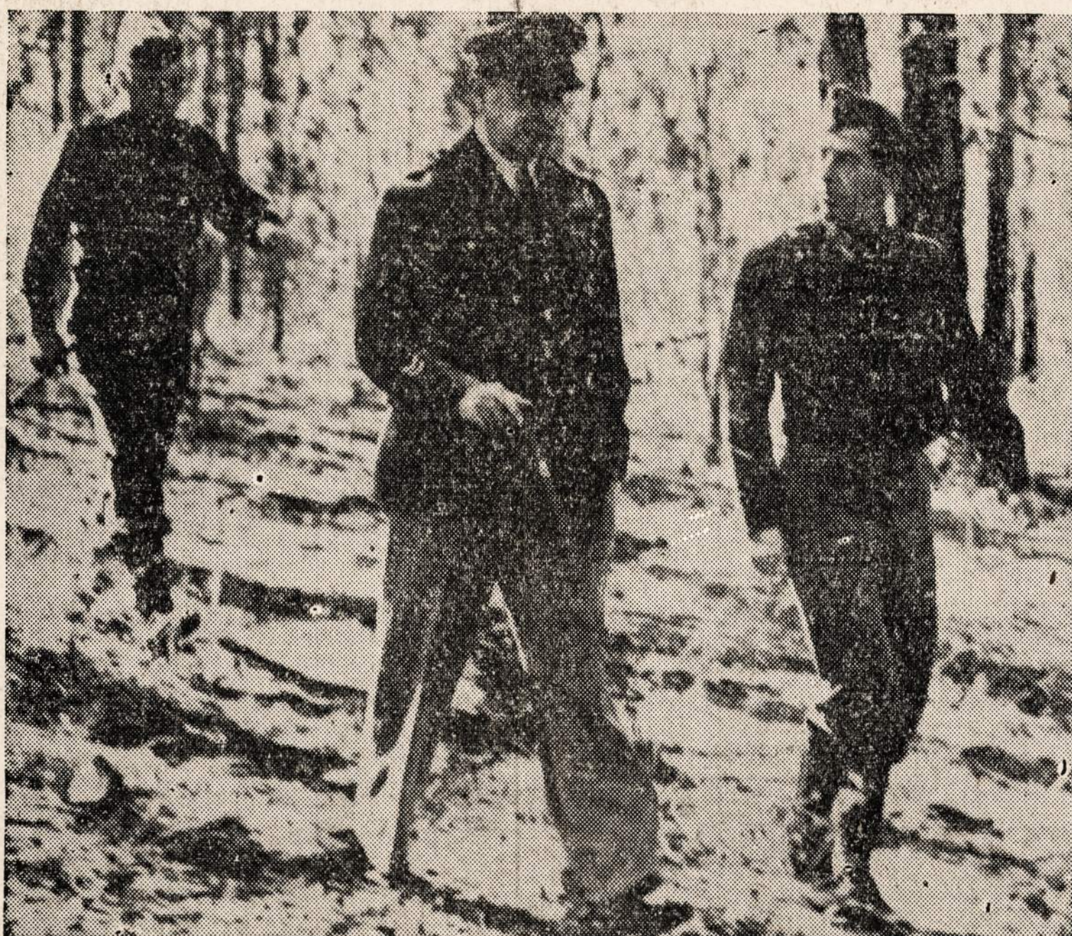
Gen. Douglas MacArthur kažkur Australijoje apžiuri Amerikos ginkluotą jėgą. Generolas ragino kiekvieną karį nors vieną japoną sunaikinti.