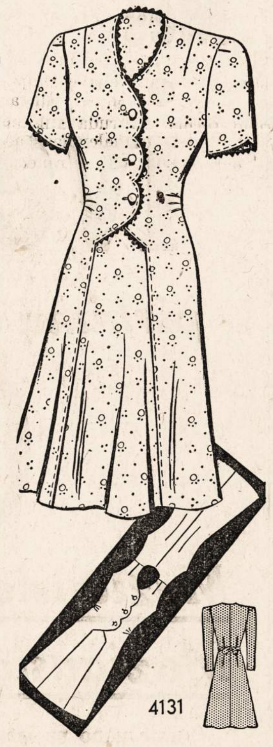
No. 4131 — Namie dėvėti suknelė. Sukirptos mios 36, 38, 40, 42, 44, 46, 48 ir 50.

Norint gauti vieną ar daugiau virš nurodytų pavyzdžių prašome iškipti paduotą blankutę arba priduoti pavyzdžio numerį pažymėti miarą ir aiškiai parašyti savo vardą pavardę ir adresą. Kiekvieno pavyzdžio kaina 15 centų. Galite pasiūsti pinigų arba pašto ženkleliais kartu su užsakymu. Laiškus reikia adresuoti: Naujienos Pattern Dept., 1739 So. Halsted St., Chicago, Ill.