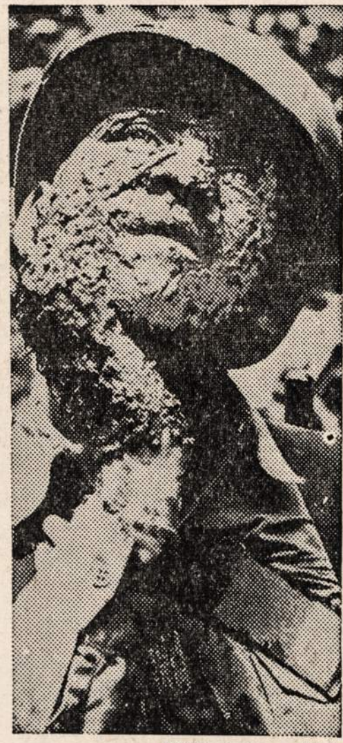
Vadinamųjų "bushmasters" (džunglių armijos) narys Panamos srityje. Jis apdengia veidą purvo kauke, kad susiderintų su džunglių spalva.