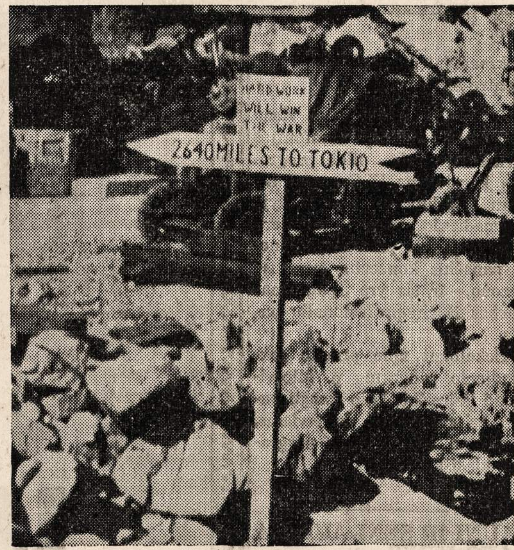
Zenklas parodo Amerikos ginkluotų jėgų, kurios ištvirtino Andreevo saloje, objektyvų japonų atžvilgiu. Iš tos salos amerikiečiai pradės ofensyvą, kurio tikslas bus išvyti iš Aleutų salų.

Tas faktas, kad sovietų Rusija dar tebeprapažįsta ir laiko pas save tariamą "Lietuvos Tarybų Valdžią", rodo, kad Maskva eina prieš Anglijos ir Amerikos politinį nusistatymą. Juok ir mūsų bimbinkai ži-