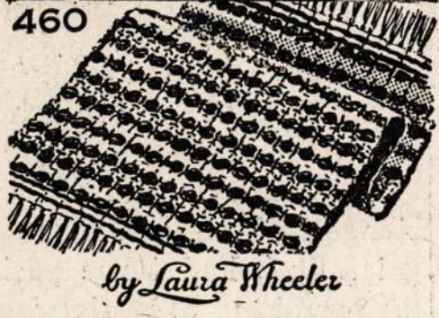
No. 460 — Audiniai

NAUJIENOS NEEDLECRAFT DEPARTMENT 1739 S. Halsted St., Chicago, Ill. No. 460