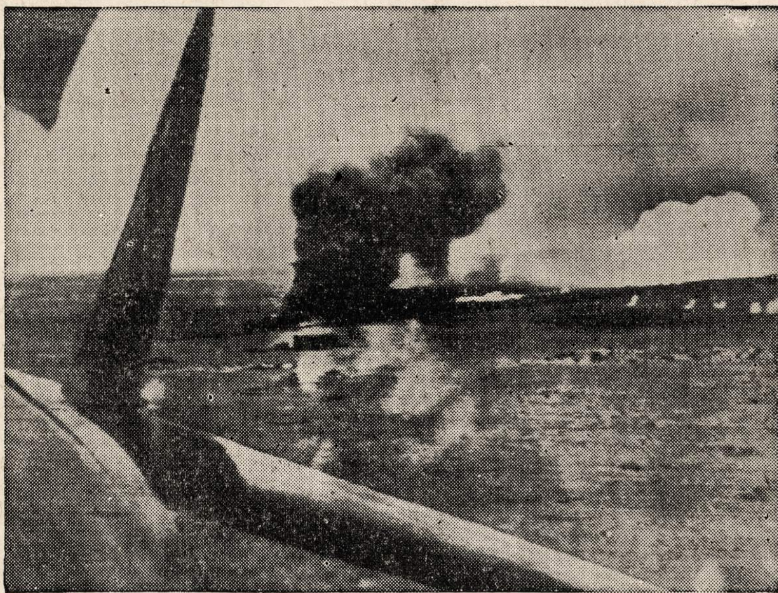
Anglijos lėktuvai sunaikino Ašies traukinį, kuris vežė armijai amuniciją ir kitas reikmenes.

Bėgyje 1940 ir 1941 metų jis davė eilę paskaitų DePaul Universitete Chicagoje ir Iowa valstijos Teachers Clinic.