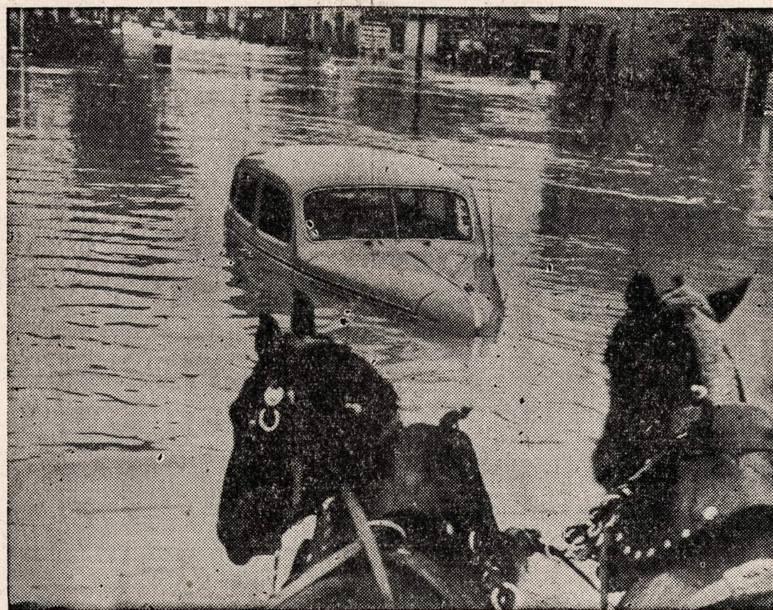
Potomac upės potvinis netoli Washington, D. C.