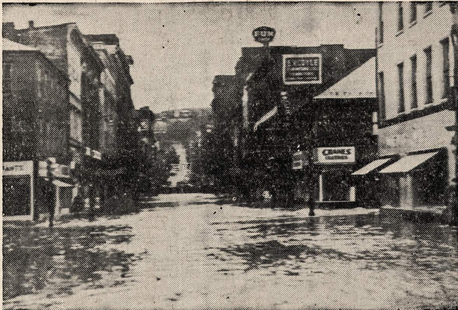
Potomac upės vanduo apšėmė Cumberland (Md.) gatvę. Kylančios upės vanduo grumuoja ir Washington, D. C.

Dar toliau, tais pačiais metais, Malko padarė savo pirmąjį pasirodymą su Chicago Simfonijos Orkestra, diriguodamas seriją koncertų Ravinijos Festivalyje, ir tuojuo buvo angažuotas sekantiems metams. Nuo tada Malko pasirodė keliuose koncertuose, diriguodamas Fine Arts ir Moterų Simfonijos orkestras.