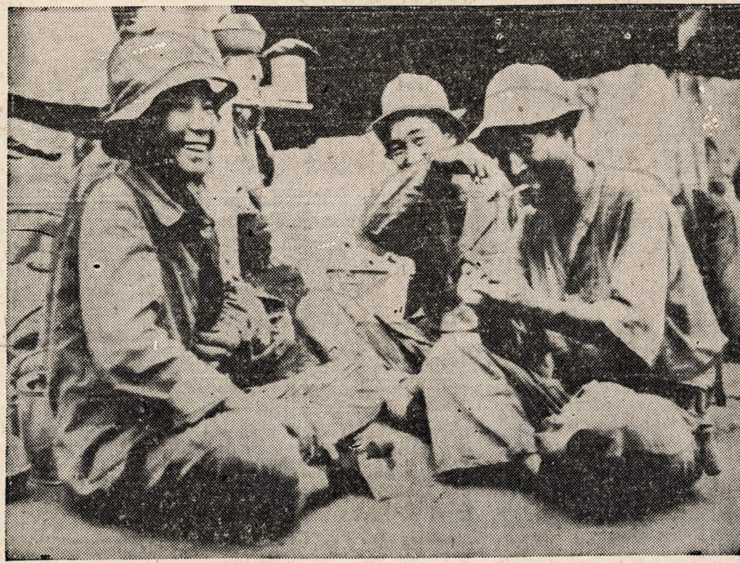
Japonai, kurie Guadalcanal muštuose pateko į nelaisvę. Jie ruko amerikoniškus cigaretas, kurių gauna po 10 per dieną.

samdytojai pasiuntė man tris laiškus, kviesdami mane į darbą. Gavau taipgi vieną iš Electo Motive. Matote, gavau visokių darbų po to, kai patekau į armiją. Pirmadienį einame šaudyti mūsų 105-sias. Išsausime dešimtį šuvių. Kaip tik dabartiniu laiku aš darbuojus prie žiurono, nes, mat, esu šaulys ir turiu nusimanyti apie taikymą, kai pradėsime šaudyti. Neužilgo turėsiu jums tulus vaizdelius, kuriuos nutraukiau prieš porą savaitių, bet dar nespėjau juos apdirbti. Laikas čia tikrai lekia. Aš esu armijoje 66 dienas, ir mokėjimo diena tik už savaitės šį mėnesį gausiu $54, bet čia neminiu išskaitymo. Taipgi turiu padavęs aplikaciją į kariūnų treniravimo mokyklą. Apie 15 iš mūsų baterejos gavo jas, tarp kitų gavo ir seržantai. Taigi aš turiu gan gerą progą vykkti ten. Mokykla randasi Oklahoma valstijoje. Ar jusų švogeriš tebėra ten? Tark nuo manęs Hello mano pažintims ir savo žmonai. So long — Cy.