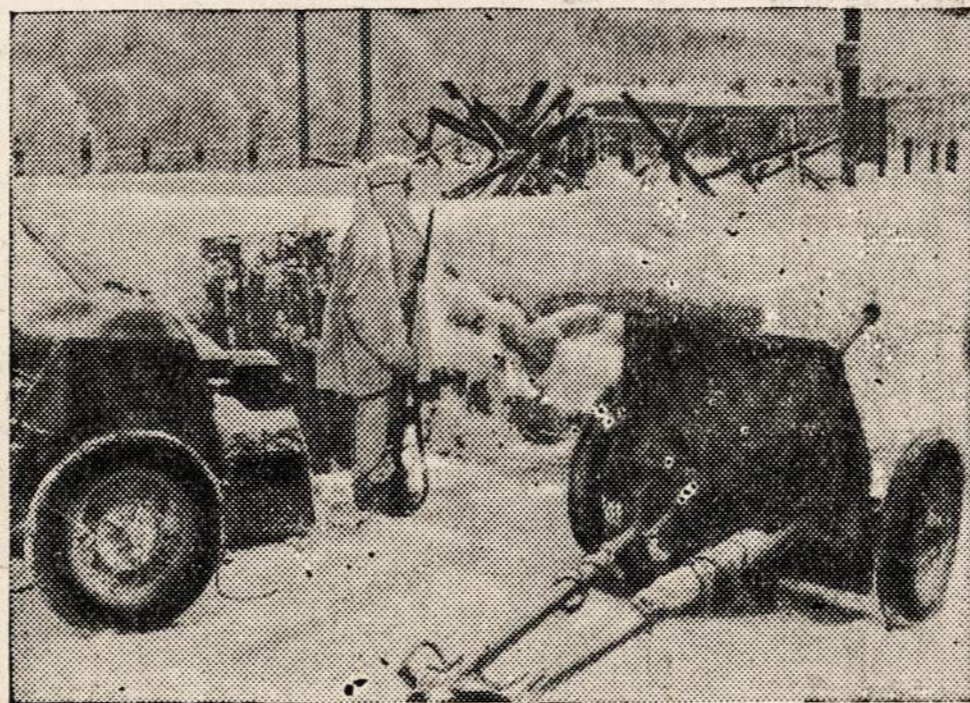
Randolph prie Dearborn

Nuo rytojaus dienos, penktadienį, spalio 23 d., pradės rodyti "Moscow Strikes Back". Tas paveikslas bus rodomas dar pirmą syk. Jis yra nuimtas sovietų fotografo pačiame dabartiniame karo fronte.