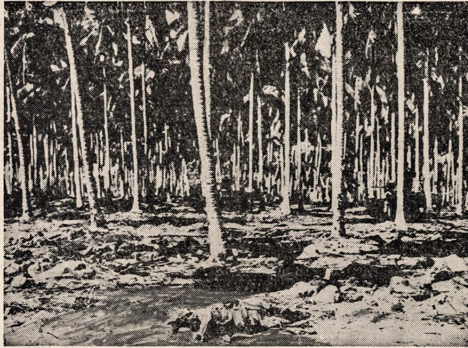
Japonų užmušti kareiviai prie Tena uopės Guadalcanal saloje, kur įvyko smarkūs mušiai ir Amerikos mariniai ištuos japonus iš įsitvirtinimų.