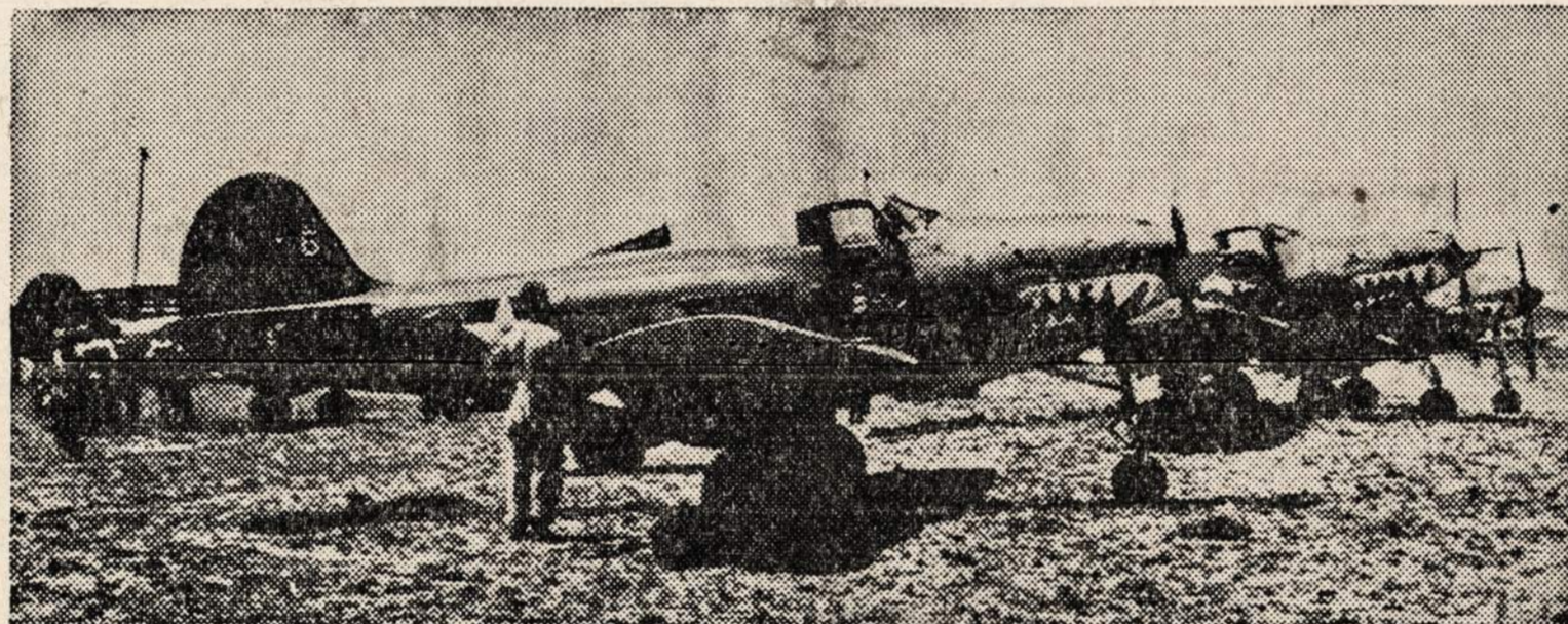
Armijos lėktuvai, kurie buvo nufotografuoti Guadalcanal skraidykoje. Tos rusies lėktuvai dabar daro didelį nuostolį japonams Solomonų salose.