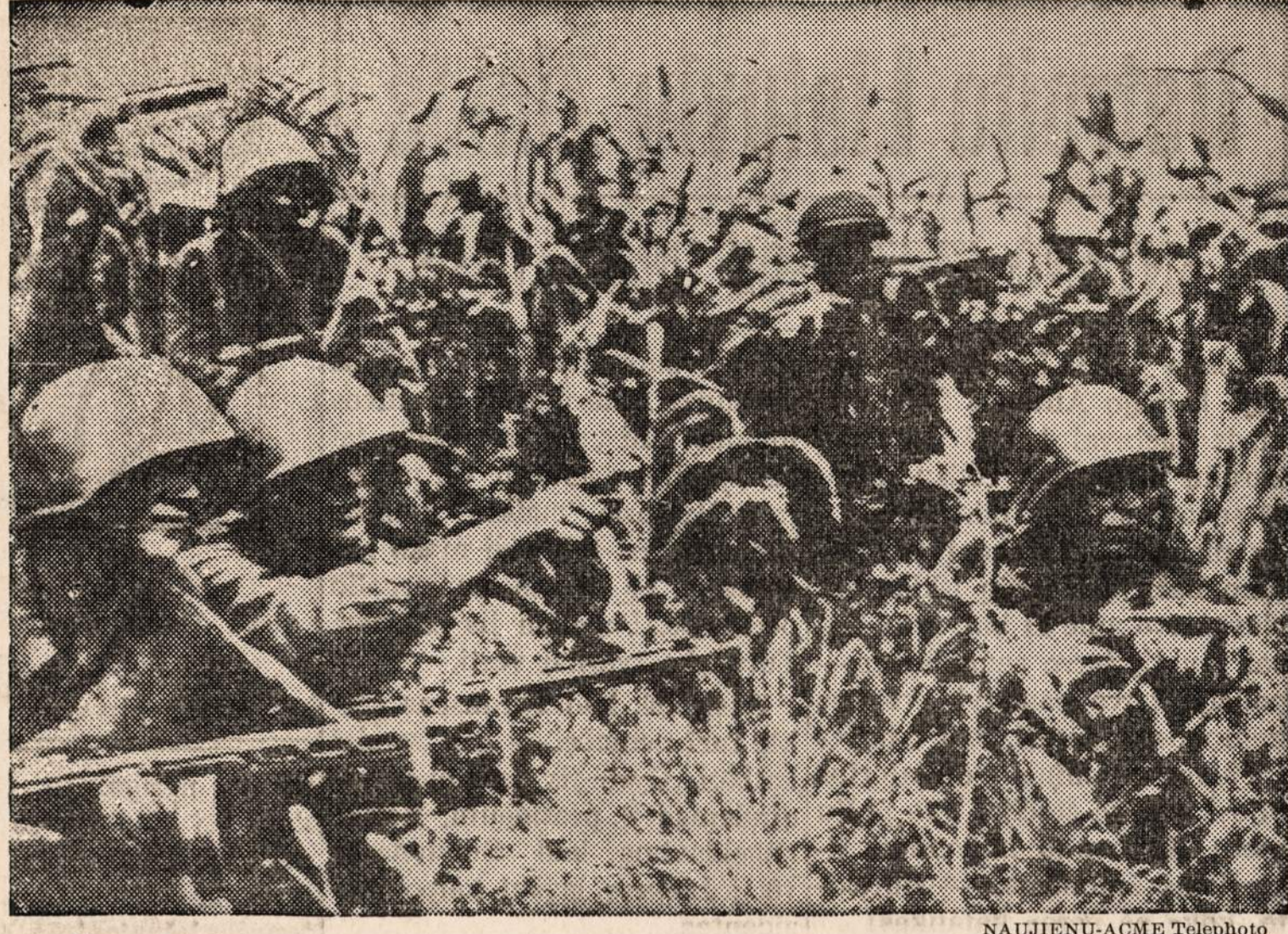
Rusų kariai, apginkluoti moderniškomis mašininėmis kanuoėmis laukia nacių Stalingrado apylinkėje, kur mušiai siaučia jau trečias mėnesis ir kur vokiečiams vėl teks susidurti su nemalonia Rusijos žiema.

Sunku suprasti, ką Gandhi norėjo pasakyti žodžiais, kad Jungtinės Tautos būtų "toleruojamos Indijos žemėje", — kuomet joms tenai nebus leista turėti savo armijos. Dabar pagalvokite, ar išmintingai elgiasi tie amerikoniai (pav. Wendell Willkie), kurie bėra Angliją, kant ji nesiskubina atiduoti Indiją į Gandhi'o rankas?