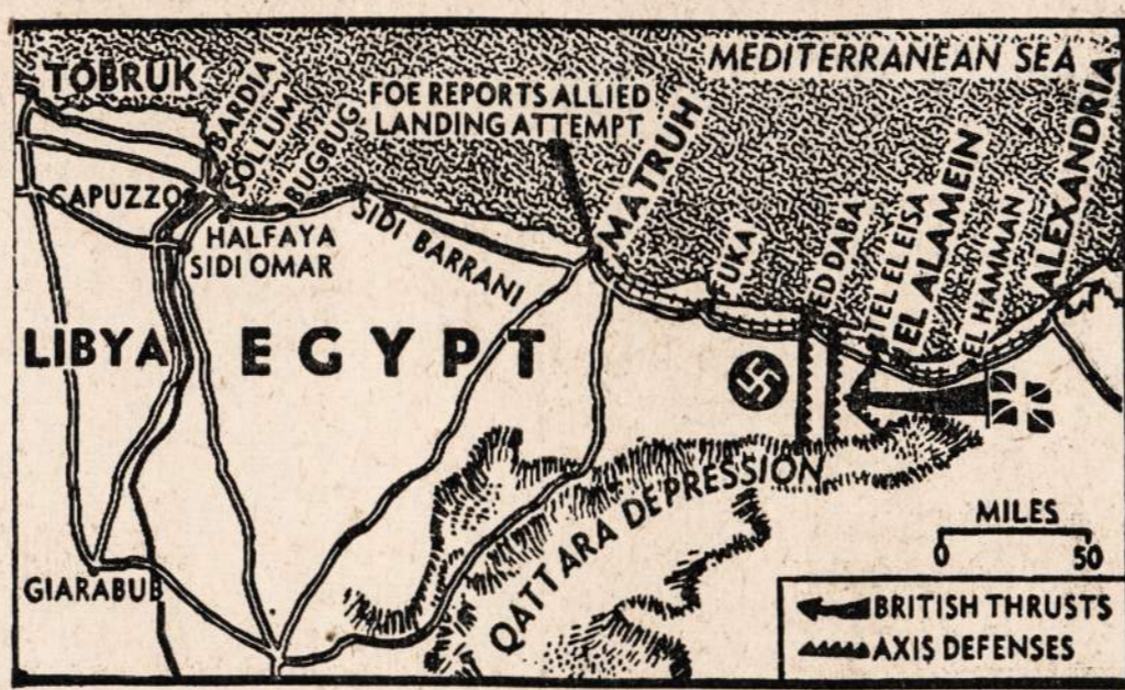
Anglų dykumos armijos daliniai pradėjo ofensyvą El Alamein srityje (Egipte). Tankai ir aviacija smarkiai puola nacių pozicijas ir tuo būdu padeda kariuomenei veržtis pirmyn.