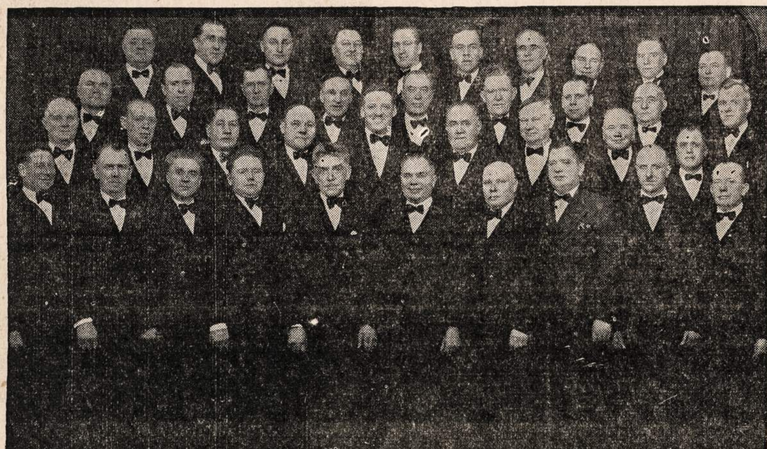
CHICAGOS LIETUVIŲ VYRŲ CHORAS