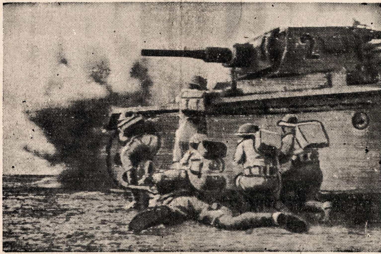
Britų infanterija šiaurinėje Afrikos mušyje veržiasi pirmyn. Rommelio armija liko smarkiai sumušta ir betvarkiai traukiasi atgal.