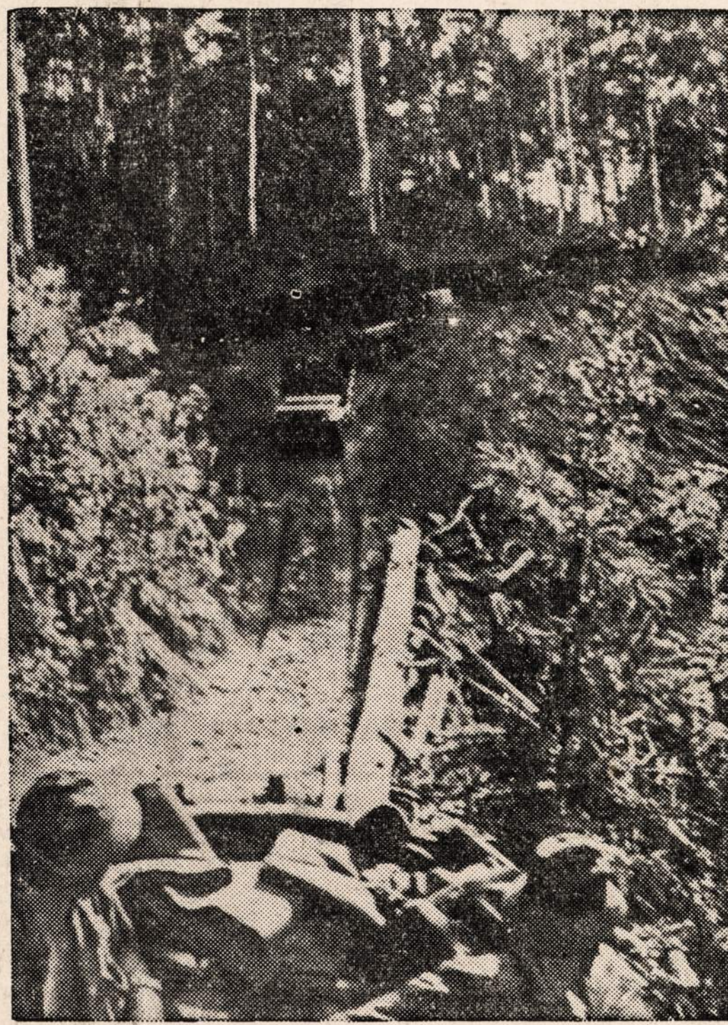
Amerikonai artinasi prie japonų bazės Naujoje Gvi- nėjoje. Iš kitos pusės japonus atakuoja australiečiai.