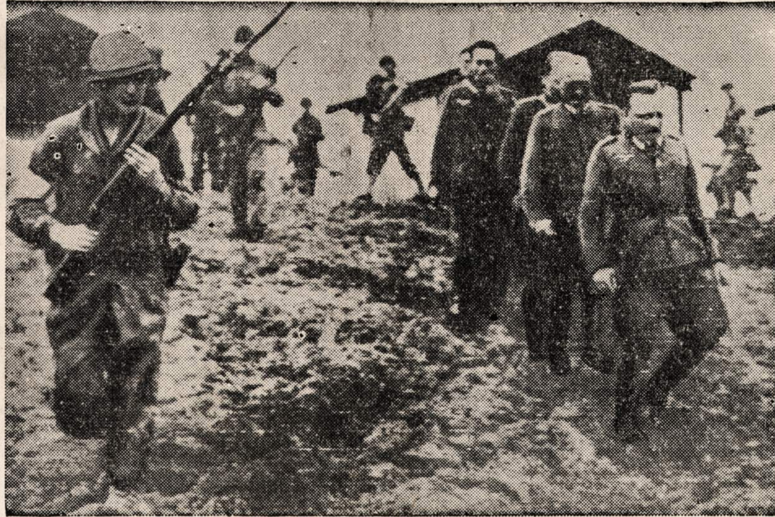
Penki Italų-Vokiečių Paliabu Komisijos nariai, kurie Marokos mieste Fedala valgė pusryčius, kai juos užklupo Amerikos kariuomenė. Dabar jie, žinoma, yra amerikonių belaisviai.