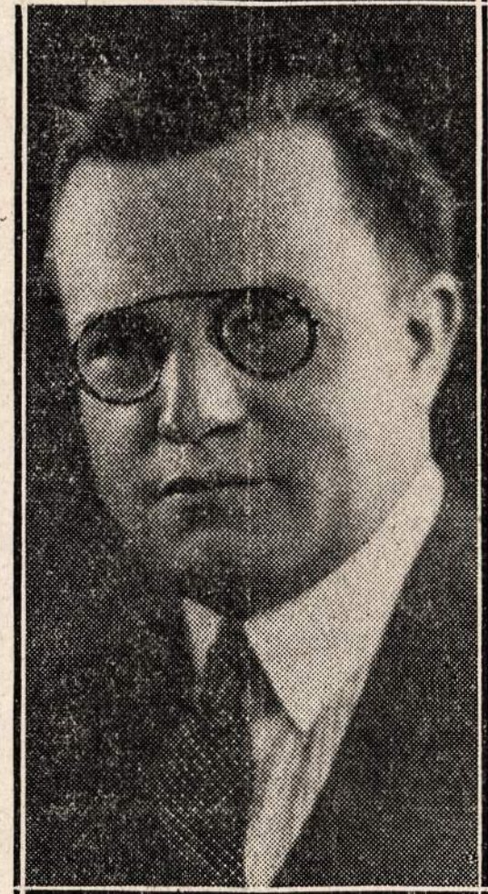
A. A. SLAKIS ADVOKATAS