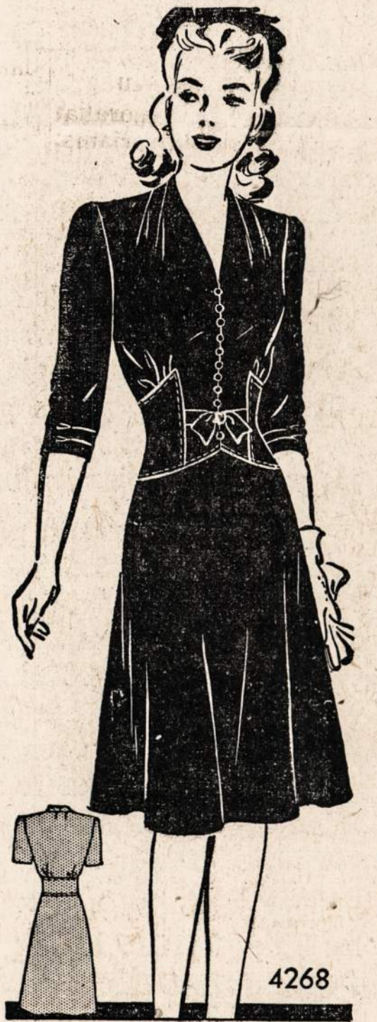
No. 4268—Išėiginė suknelė. Sukirtpos mieras 12, 14, 16, 18, 20.

Norint gauti vieną ar daugiau virš nurodytų pavyzdžių prašome iškirpti paduotą blankutę arba priduoti pavyzdžio numerį, pažymėti mierą ir aiškiai parašyti savo vardą, pavardę ir adresą. Kiekvieno pavyzdžio kaina 15 centų. Pasiuntimas 1c; viso 16c. Galite pasiųsti pinigų arba pašto ženkleliais kartu su užsakymu. Laiškus reikia adresuoti: Naujienos Pattern Dept., 1739 S. Halsted St., Chicago, Ill.