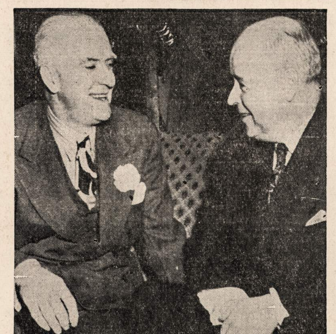
Edward J. Flynn (po kairei), Demokratų partijos nacionalio komiteto pirmininkas, tariasi su generaliu pašto viršininku Frank Walker. Flynn liko nominuotas užimti pasiuntinio vietą Australijoje.

kalyj užėgose, ir kitose patogiose vietose, ir pakeitusios savo vardus padarė didelę pažangą ir isigijo žmonių pasitikėjimą.