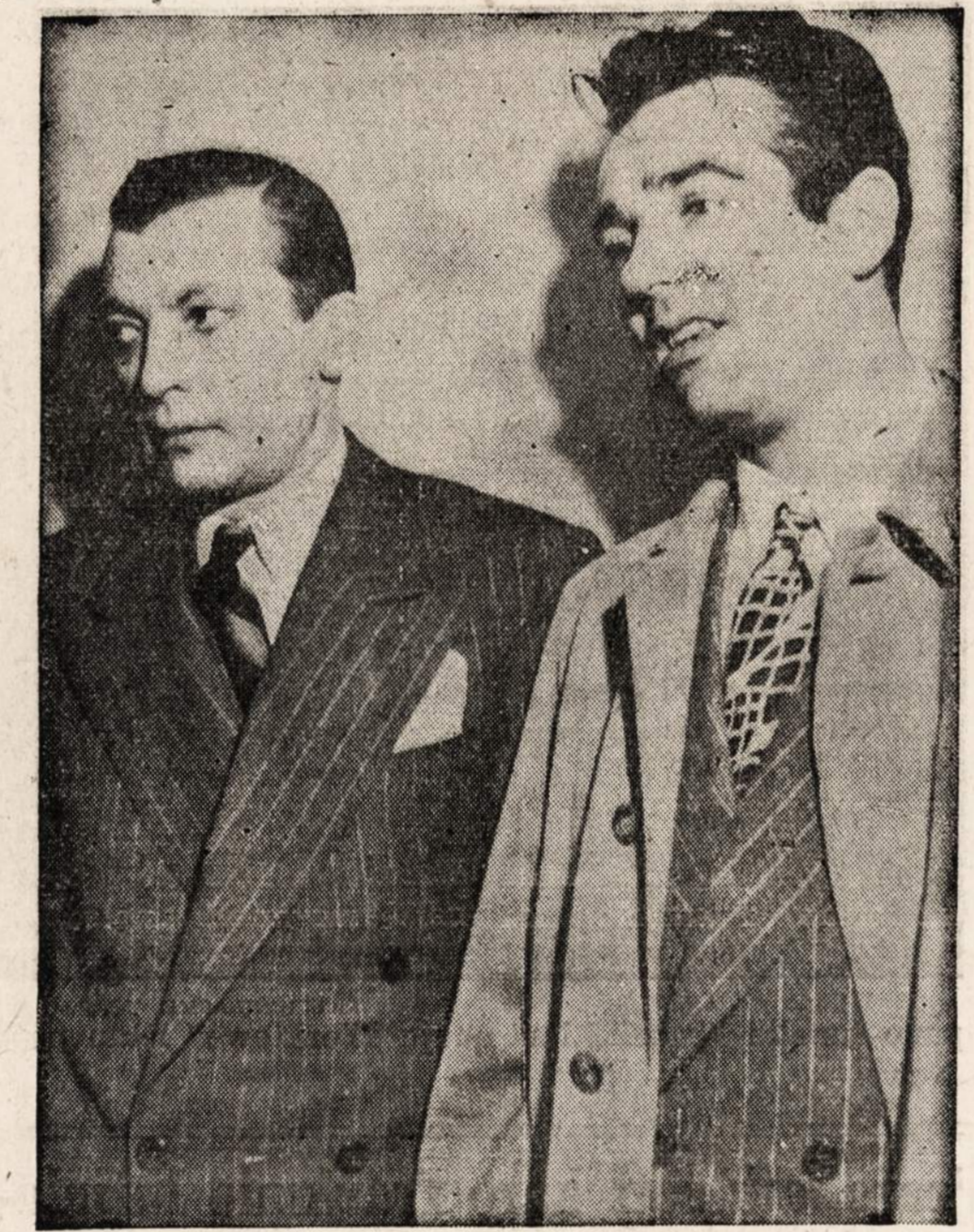
Gene Krupa, orkestro vedėjas su savo advokatu San Francisco teisme. Jis yra kaltinamas dalinimu narkotikų cigaretė.