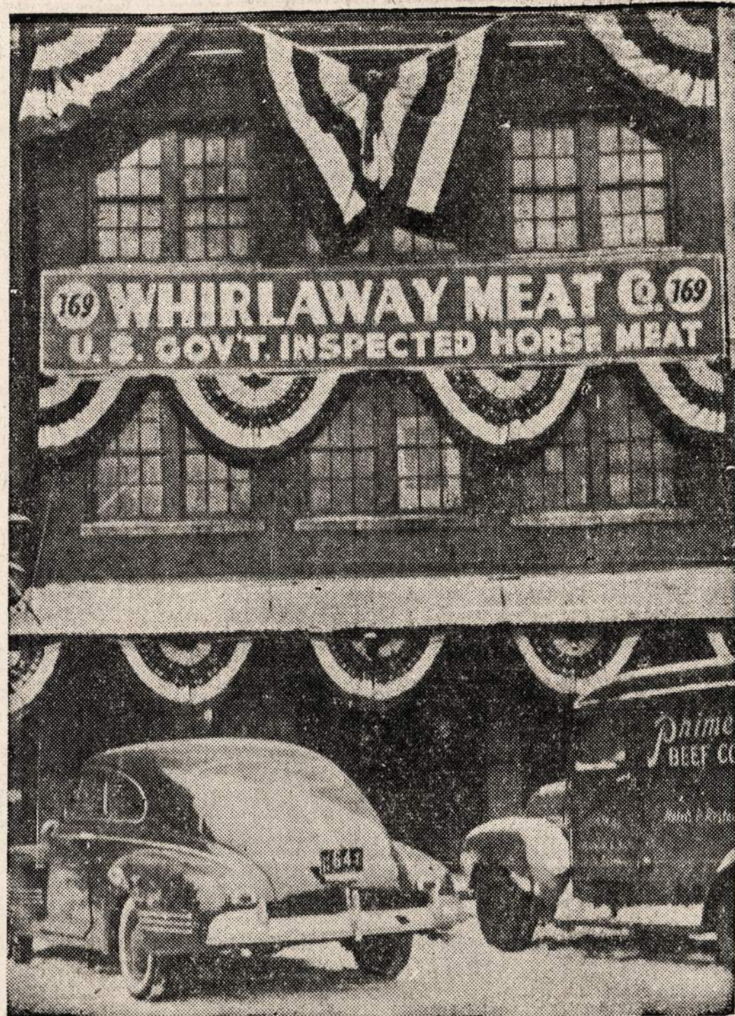
NEWARK, N. J. — Pirmą rinką arklienas pardavinėti. Čia gauta 40,000 svarų arklienas, kuri pardavinėjama žmonėms.

Nusipirkite bilietus vasario 14 dienos parengimui dabar. Gausite geresnes vietas ir į Orchestra Hall nuykūs nereikės laukti, kad nusipirkti įžangos bilietų. Visi sąmoningi lietuviai vasario 14 d., 2:30 valandą po pietų, sėdės savo vietose Orchestra Hall. — KP