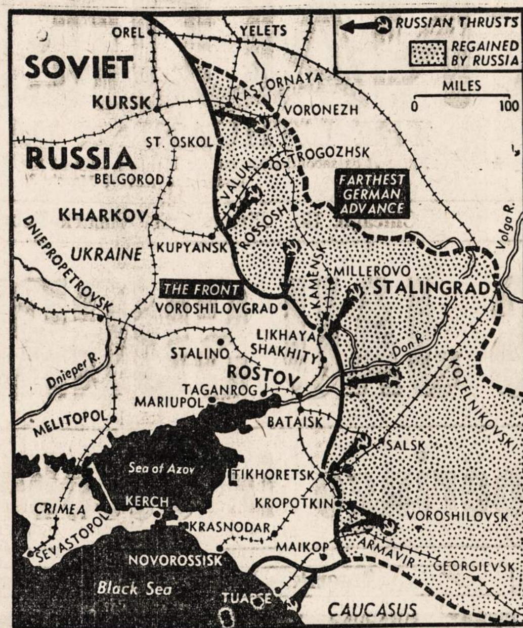
Žemėlapyje yra paženklinta teritorija, kurią sovietų armija atsiėmė iš nacių.