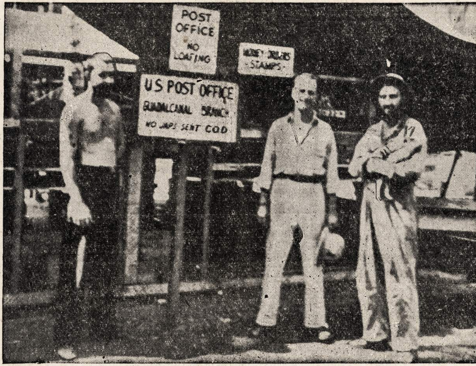
Pašto skyrius Guadalkanale, kur Amerikos kariai gauna laiškus.