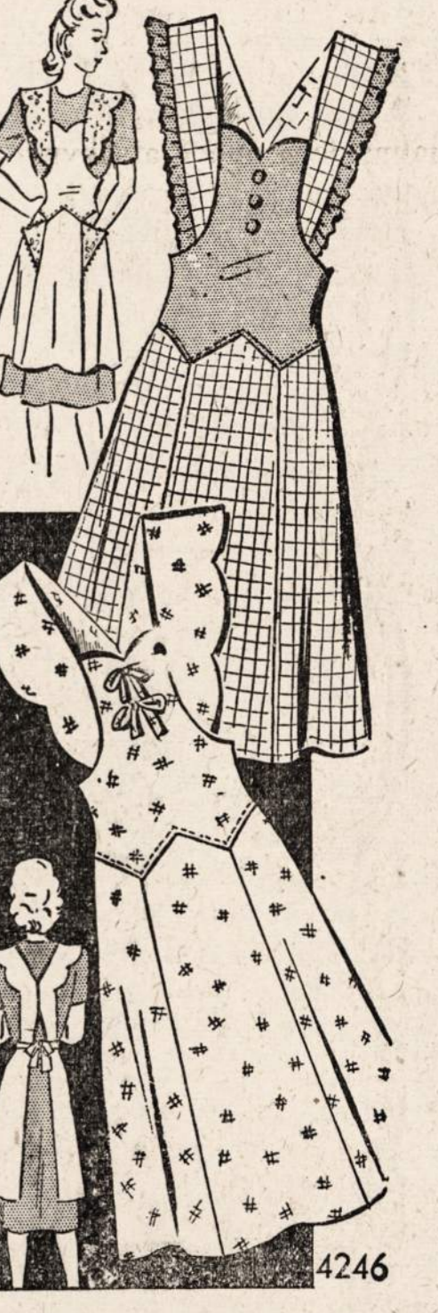
No. 4246 — Prijuostė. Maža, vidutinė, didelė.

Norint gauti vieną ar daugiau virš nurodytų pavyzdžių prašome iškirpti paduotą blankutę arba priduoti pavyzdžio numerį, pažymėti miarą ir aiškiai parašyti savo vardą, pavardę ir adresą.