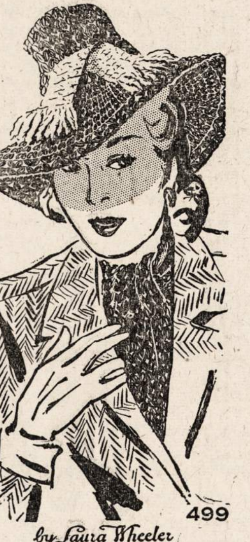
No. 499 — Megsta kepuraitė ir šalikas.

NAUJIENOS NEEDLECRAFT DEPARTMENT 1739 S. Halsted St., Chicago, Ill. No. 499