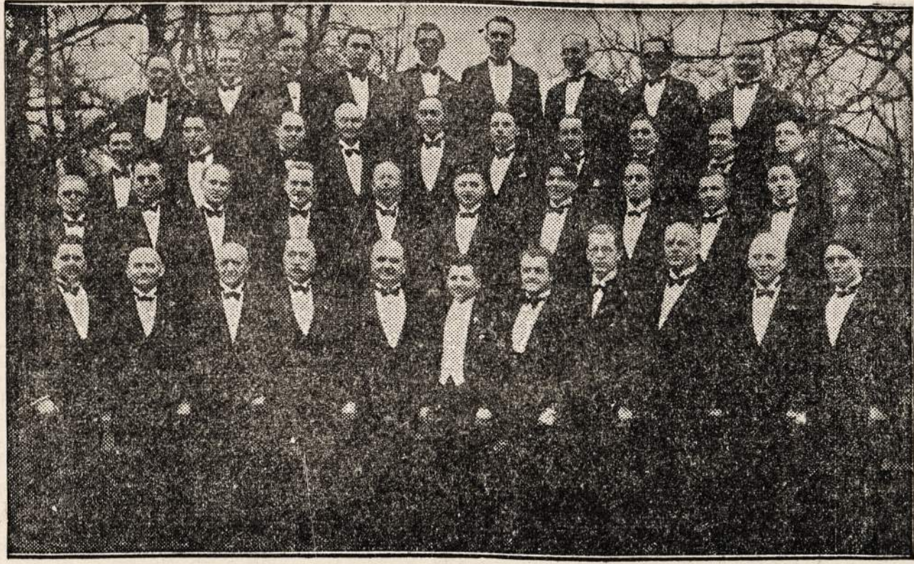
Bohemian Singing Society Lyra

Tai yra visame pasaulyje pagarsėjęs choras. Pirmą kartą dalyvaus Naujienu koncerte ir šauniai pasirodys lietuviams.