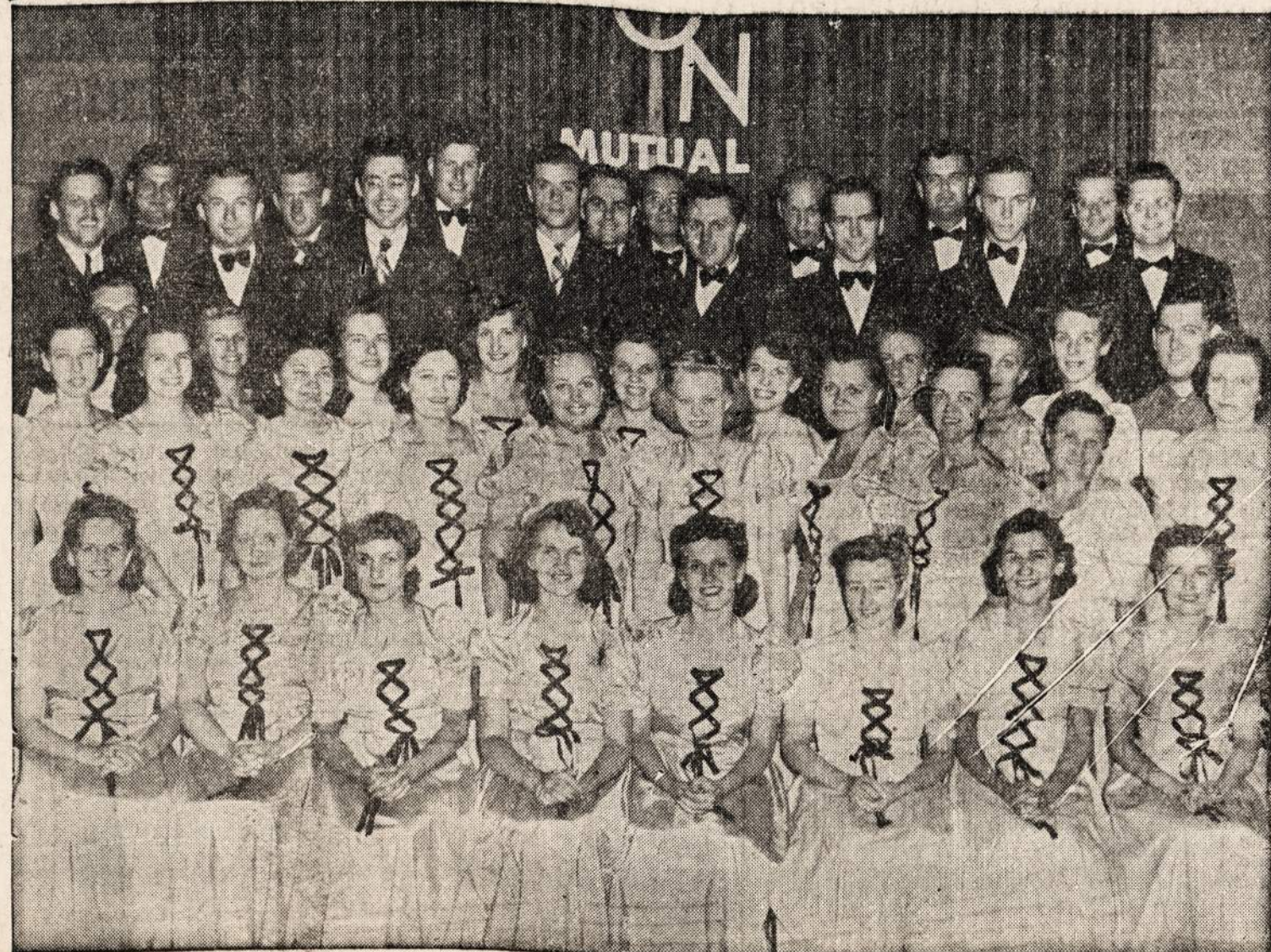
-CHICAGOS LIETUVIŲ PIRMYN CHORAS

Chicagos ir jos visų apylinkių lietuviai atsilan- kykite į šį garsųjį NAUJIENU KONCERTĄ