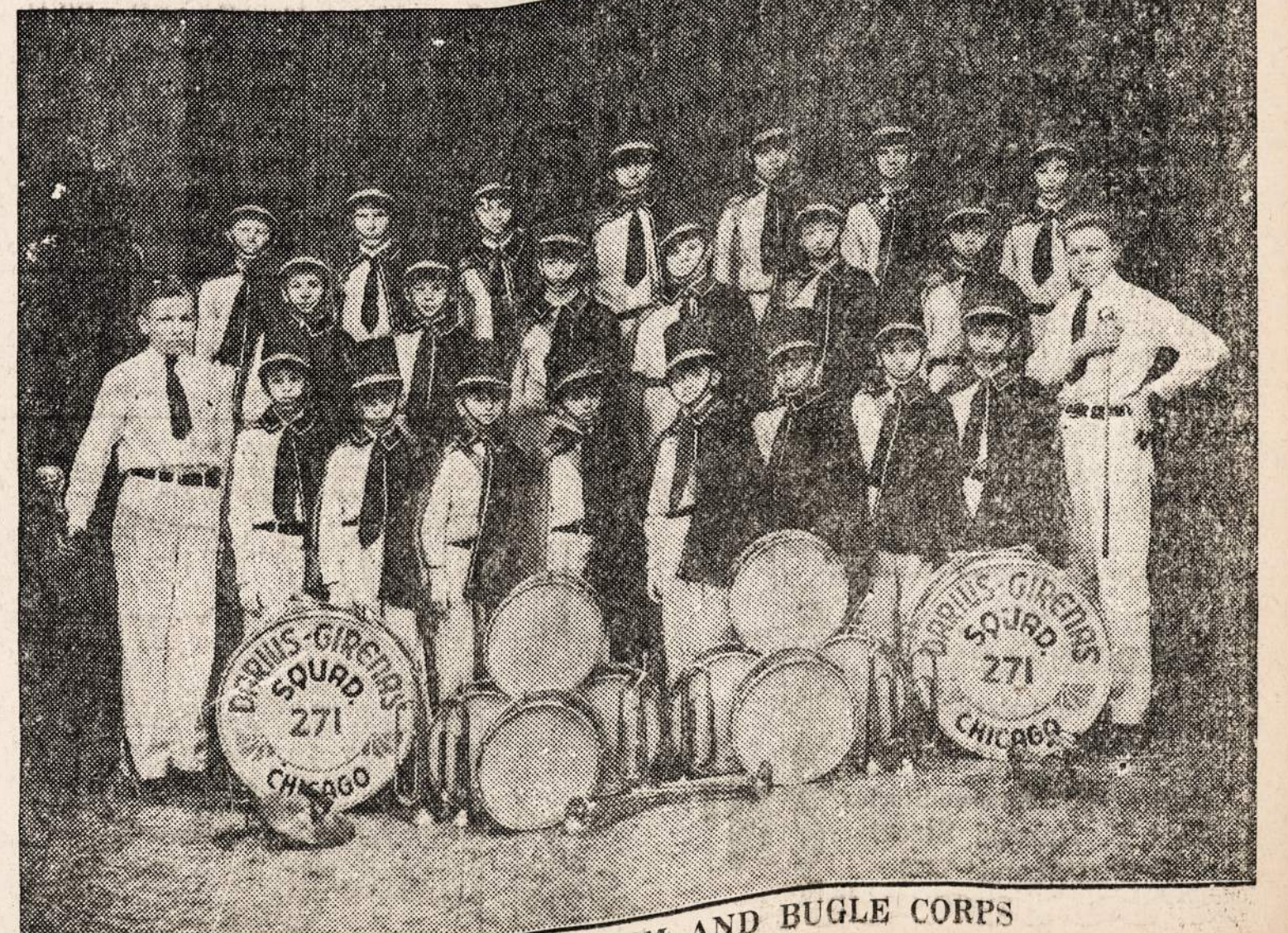
DARIUS-GIRENAS DRUM AND BUGLE CORPS

Chicagos ir jos visų apylinkių lietuviai atsilan- kykite į šį garsųjį NAUJIENU KONCERTĄ