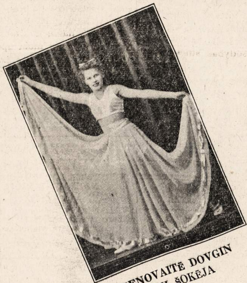
GENOVAITE DOVGIN ŽYMI ŠOKEJA