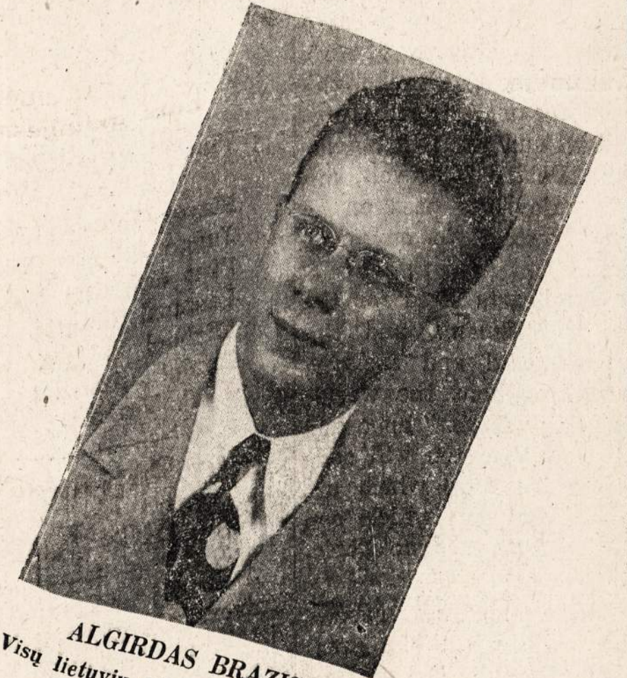
ALGIRDAS BRAZIS Visų lietuvių mėgiamas baritonas