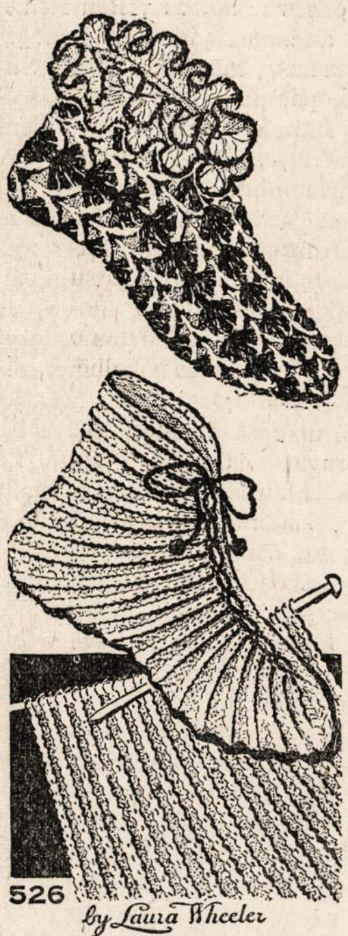
526 by Lynn Wheeler