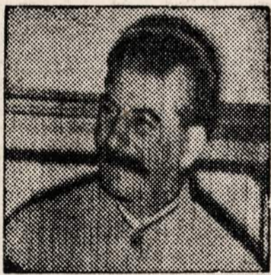
Stalinas, naujas sovietų maršalas

LONDONAS, kov. 7 d. — Maskvos radijas šiandien paskelbė, kad sovietų premjeras Josifas Stalinas pasiskelbė sovietų armijos maršalu.