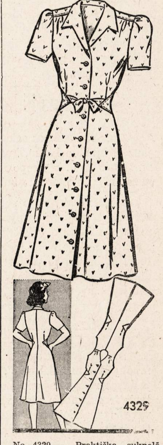
No. 4329 — Praktiška suknelė. Sukirptos miereis 12, 14, 16, 18, 20, 30, 32, 34, 36, 38, 40.

Norint vieną ar daugiau pavyz- džių iškirpti pavyzdį ir numerį, pažymėkit mirę ir aiškiai parašykite avo vardą, pavardę ir adresą. Sius- kit pinigų arba pašto ženkliuolu kartu su užsakymu. Adresuokit- NAUJIENOS PATTERN DEPT., 1739 So. Halsted St., Chicago, Ill.