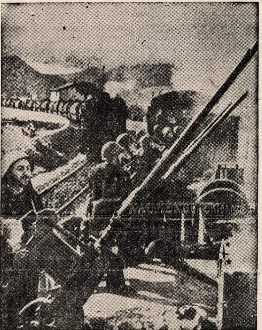
Italų traukinys, kuris veža naftą, yra ginamas prieš lėktuvinės kanuolės. Paveiksias gautas iš neutralios šalies