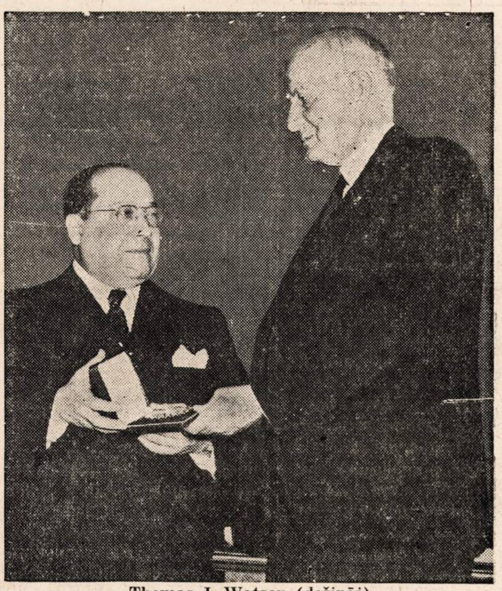
Thomas J. Watson (dešinė)