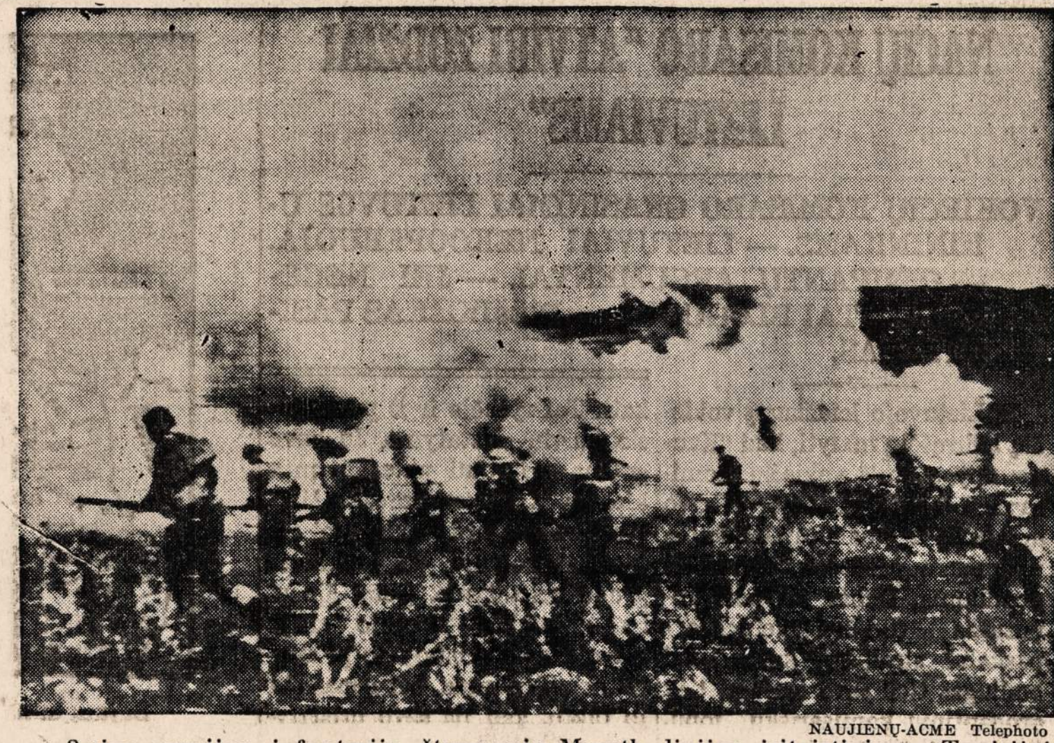
8-sios armijos infanterija šturmuoja Mareth linijos įsitvirtinimus Tunisiijoje.

Tačiau Julius Smetona, demokratinėje Amerikoje radęs prieglaudą, drįsta pasakoti, kad ta šlykšti smetoniško fašizmo sistema buvusi "demokratija".