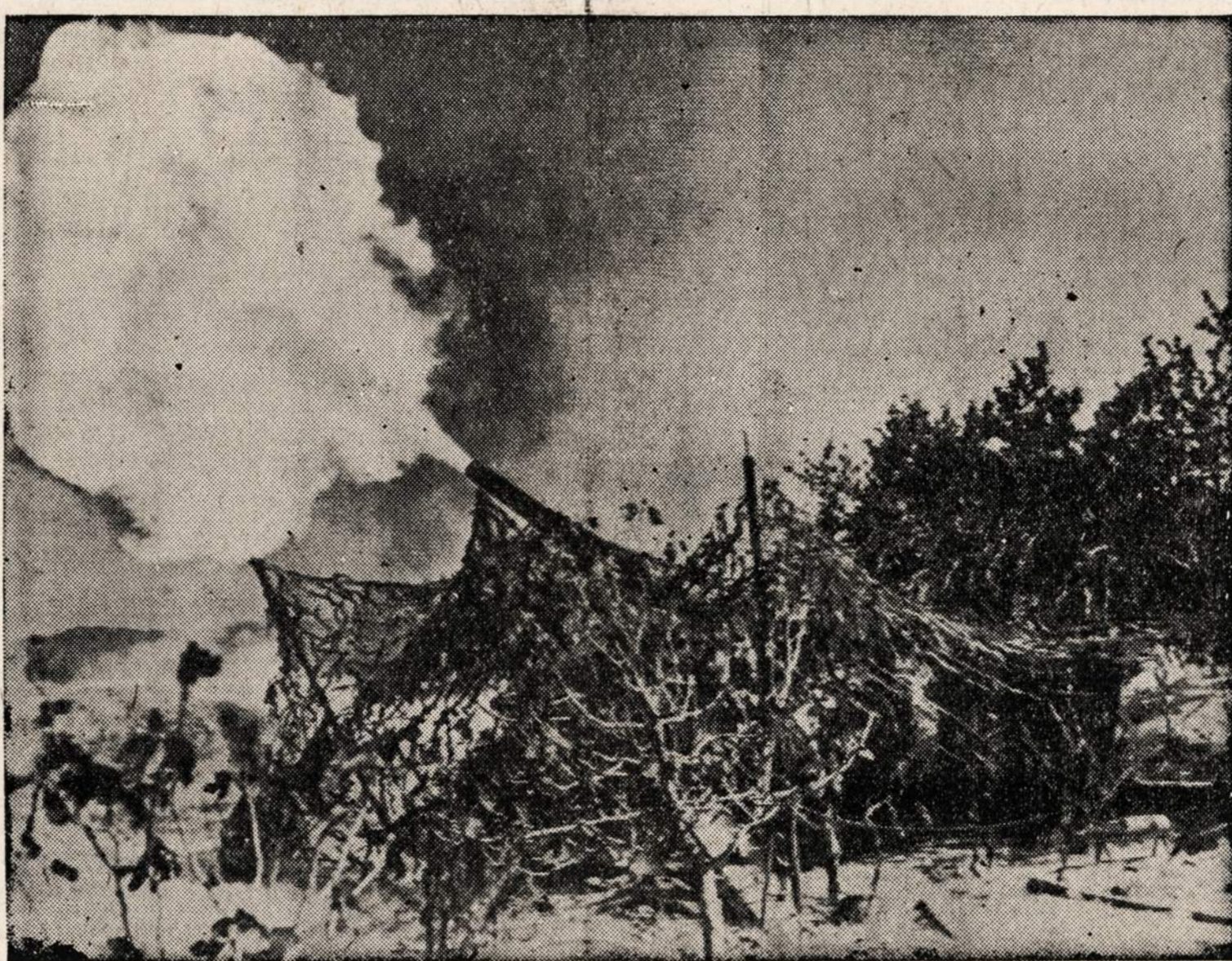
Paslėpta Amerikos kanuolė, kuri yra žinoma kaip "Long Tom", veikia centralinėje Tunisioje.