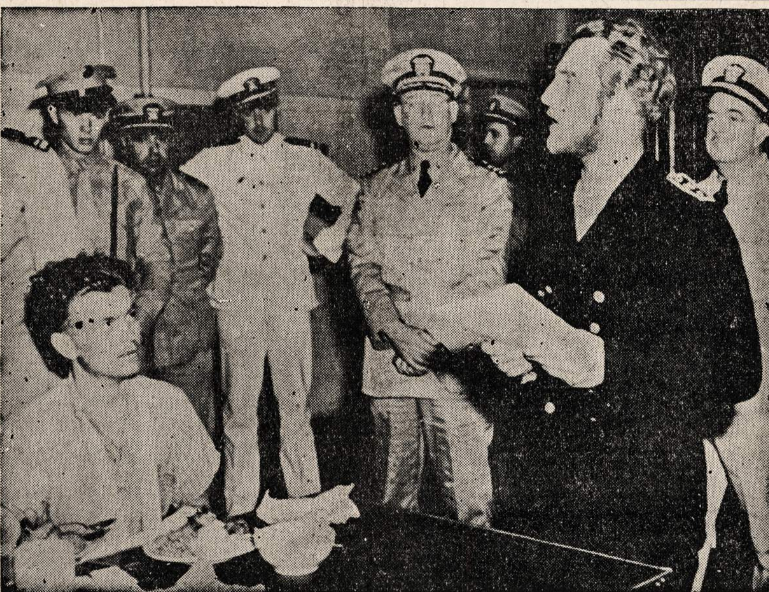
Vokiečių submarino karininkas. Prie Carolina pakraščio submariną paskandino Amerikos laivas ICARUS. Submarino igula (kai kurie buvo sužeisti) pateko į nelaisvę.