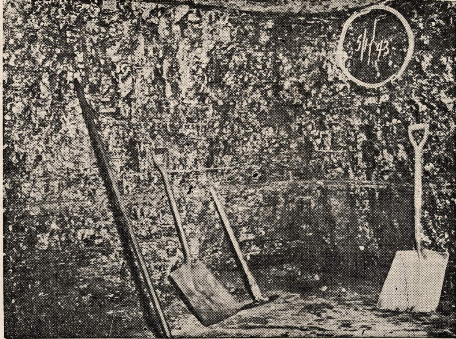
RICKEYVILLE, PA. — Angliakasiai sudėjo savo įrankius ir apėjo kasyklą iki tolimesnio patvarkymo.

3241 So. Halsted Street TEL. CALUMET 7237 KRAUTUVĖ — RAKANDŲ — RADIO—JEWELRY