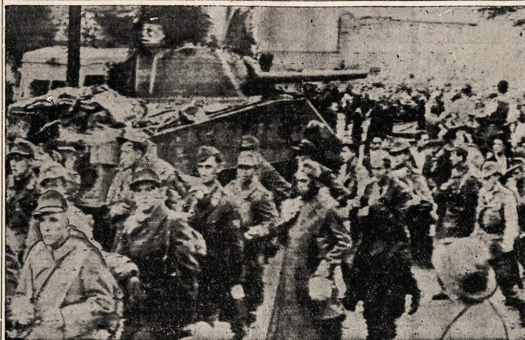
ASIES KARIAI, KURIE SUIMTI Į NELAISVĘ TUNISIJOJE