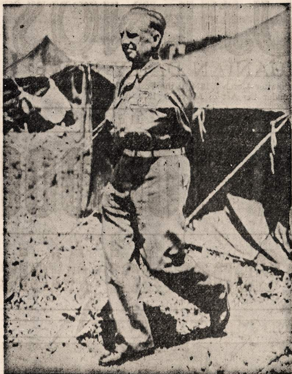
Lt. Gen. Leslie J. McNair, Amerikos sausžemio kariuomenės vadas Afrikoje, su "Purple Heart" pažymėjimu apleido ligoninę, kur jis buvo atsideręs dėl žaizdų.

Superior miestas priskaito 35,000 žmonių, o iškilnių pažiūrėti suvažiavo 50,000 žmonių. Miestelis buvo užtvines