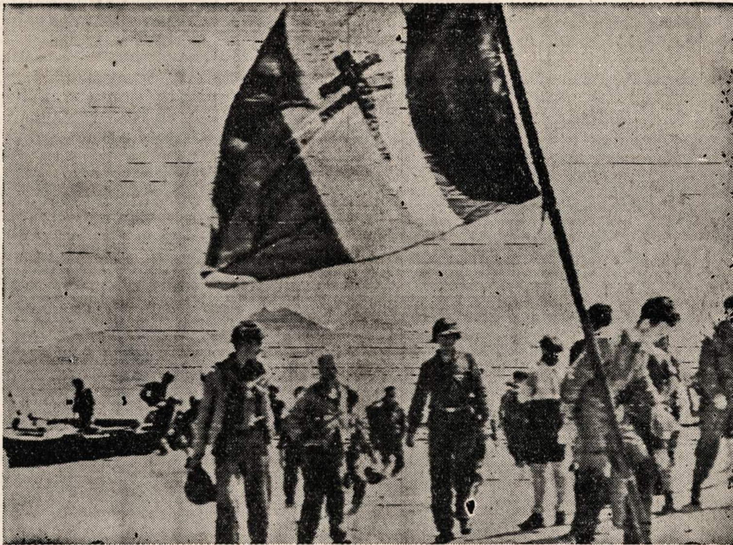
Amerikos ir Britų kareiviai, kurie buvo suimti į nelaisvę ir susodinti į laivus, atgavo laisvę, kai Britų armija įsiveržė į Tunisą.