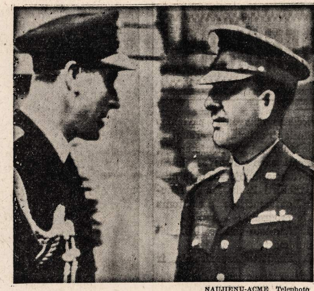
Lt. Gen. Jacob L. Devers (po dešinei) atvyko į Londoną perimti Amerikos ginkluotų jėgų vadovybę.

To niekas negali išaiškinti. Aišku tik viena, kad Stalinas užmušė du demokratinio darbininkų judėjimo vadus, visą savo gyvenimą kovojusiu už darbo žmonių laisvę ir geresnę žmonių ateitį.