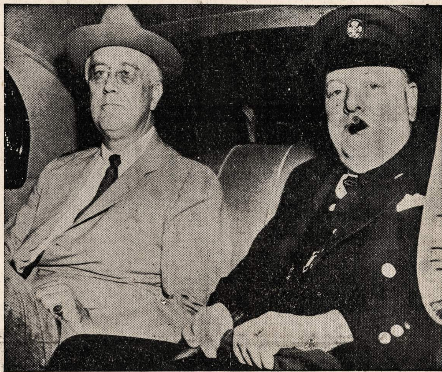
Premjeras Winston Churchill (po dešinei) atvyko į Washingtoną tartis su Prezidentu Rooseveltu. Čia abu jie parodomi automobilyje. Tai bus trečias nuo karo prasidėjimo Churchill apsilankymas Washingtono.