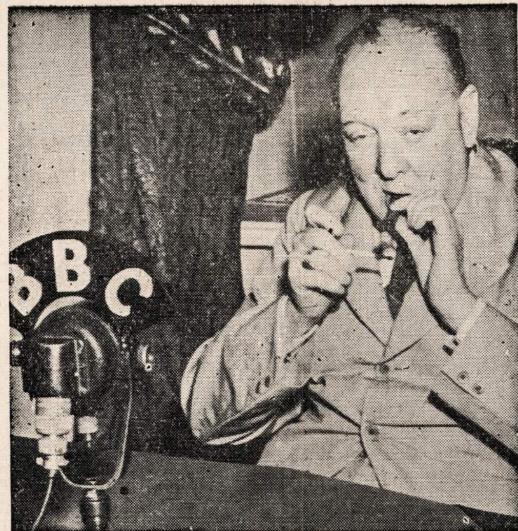
Winston Churchill, Britų premjeras (viršuje), per radiją pasakė kalbą, kurioje jis pabrėžė, kad sąjungininkai rengiasi įsiveržti į Europą.