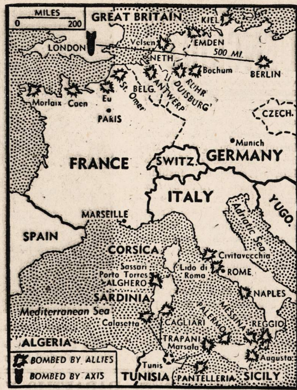
Anglų bombonešiai sudaužė Vokietijoje tvenkinius. Padarinyje milžiniški žemės plotai liko vandens apsemti. Skaudžiai nukentėjo miestai ir miesteliai. Kiek žinoma, žuvo nemažai ir žmonių.

Maistas, kurį Amerika ir Anglija siunčia į Rusiją, palaike Raudonąją armiją ir šis-tenkta civiliniams gyventojams (jeigu komisarai jo nepasiima sau). Aišku, kad be Vakarų demokratijų pagalbos, Rusija negalėtų ilgai tęsti kovą. Reikšmingas dalykas: Rusija