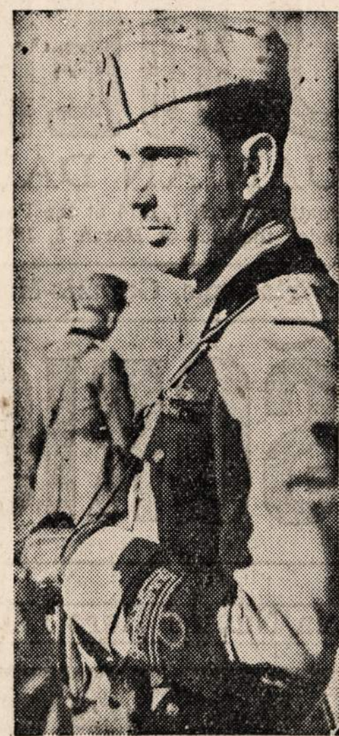
Princas Umberto, Italijos sosto įpėdinis, šiomis dienomis jis paskirtas vyriausioju Italų kariuomenės vadu.

REMHITE 100S, KURIE GARSINASI "NAUJIENOSE"