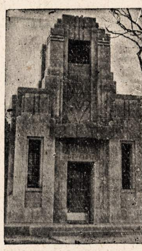
Lietuvių Tautiškių Kapinių Kopyčia.