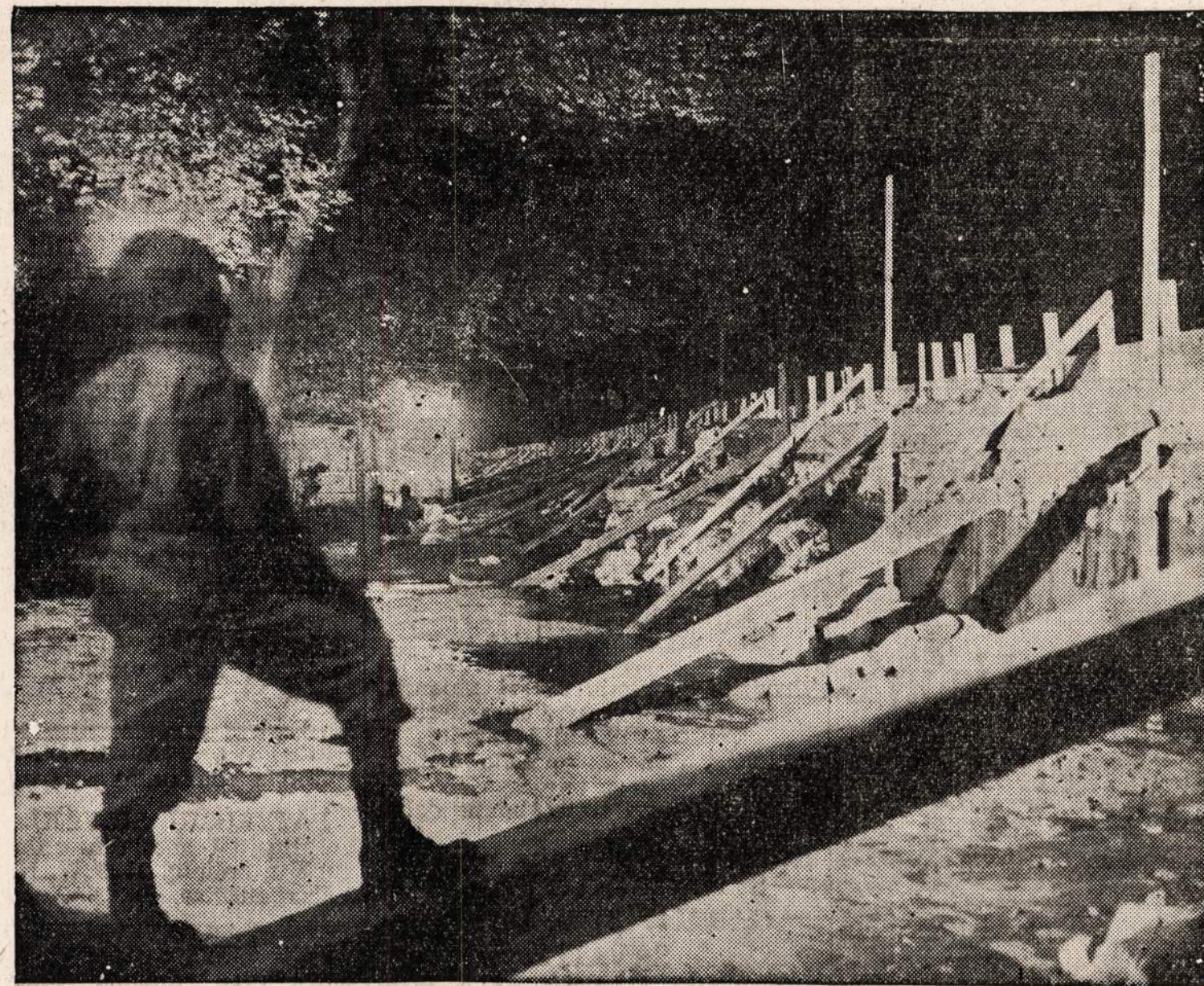
BEARDSTOWN, ILL. — Illinois upė jau pakilo aukščiau užtvankos, kurios siena yra 27 pėdų aukštumo. Kareiviai ir miestelėnai žiuri, kas bus toliau. Moterys ir vaikai liko išgubenti į saugesnę vietą.