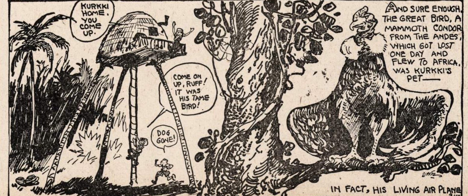
IN FACT, HIS LIVING AIR PLANE