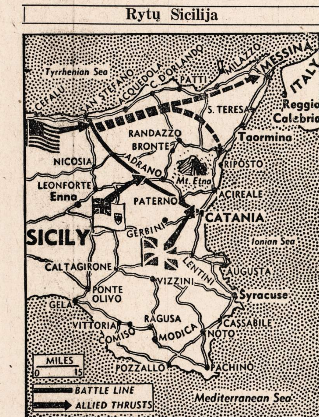
Nežiurint politinio sukrėtimo Italijoje, karas Sicilijoje tebeina visu smarkumu. Sąjungininkai iki šiol jau yra paėmę į nelaisvę per 70,000 italų ir vokiečių.

Italai bijo prancūzų keršto ir reikalauja siųsti juos Italijon, sako prancūzai.