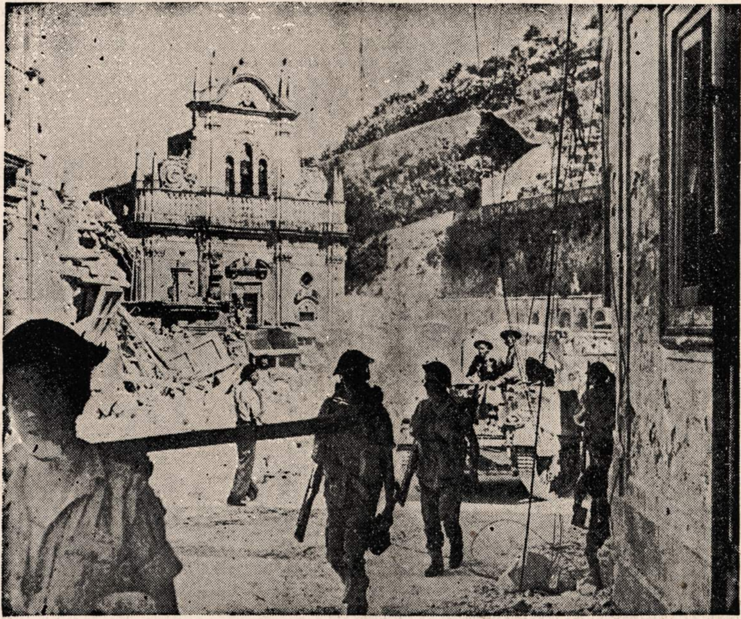
Sąjungininkų kariuomenė maršuoja per Mililli, Sicilijos miestelį. Nors miestelis ir gerokai nukentėjo, tačiau išgriauti liko tik svarbesni militariški atžvilgiai.

gas bei kiti Vokietijos pramonės miestai. Berlyno gyventojus ypačiai gąsdina Hamburgo likimas. Didžiausias Vokietijos uostas faktiškai liko griuvėsiais pavertęs. Italijos smukimas ir vis didėjančios oro atakos labai gąsdina Berlyno gyventojus, kurie jaučia, jog jie negalės išvengti karo baisenybių.