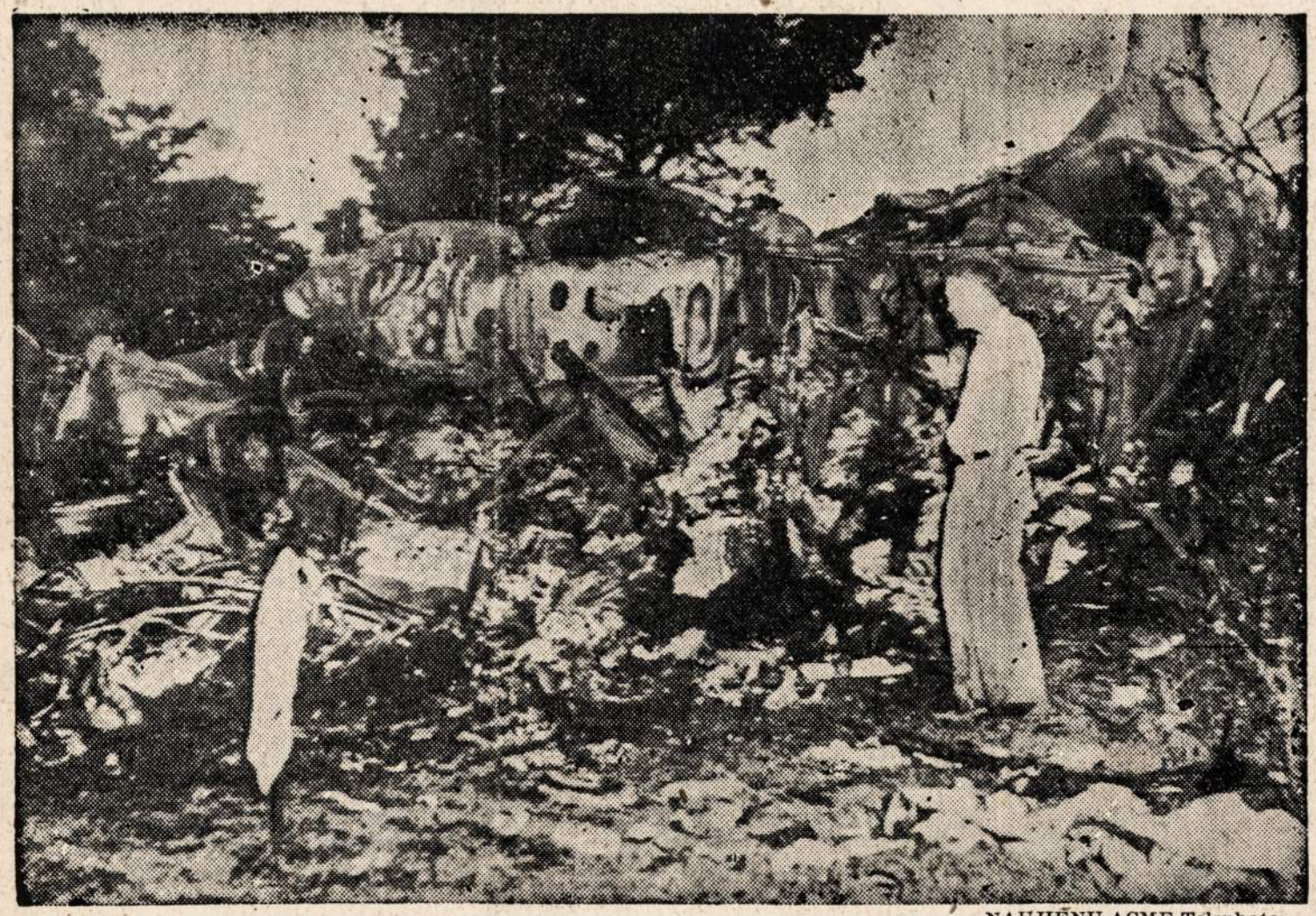
Amerikos lėktuvo palaikai. Tas lėktuvus nukrito ir sudužo netoli nuo Scottsville, Ky. Nelaimėje žuvo 20 žmonių.