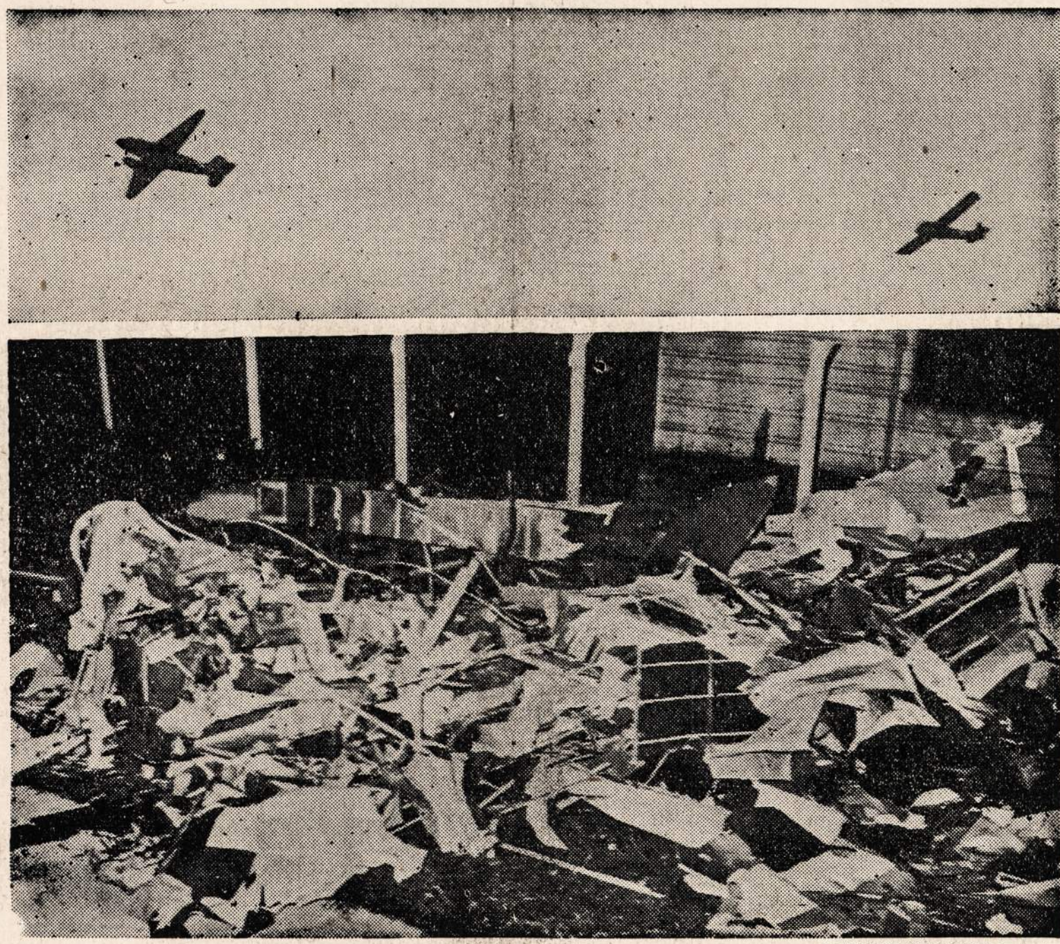
Šis paveikslas vaizduoja, kaip St. Louise įvyko sklandytuvo nelaimė, kurioje žuvo miesto majoras ir kiti 9 aukšti pareigūnai.

WASHINGTON, rugp. 3 d. — Baigiamos derybos dėl apsimainymo su japonais belaisviais. Šį kartą apsimainymo punktu liko pasirinktas Mormogao, kuris randasi Portugalų Indijoje.