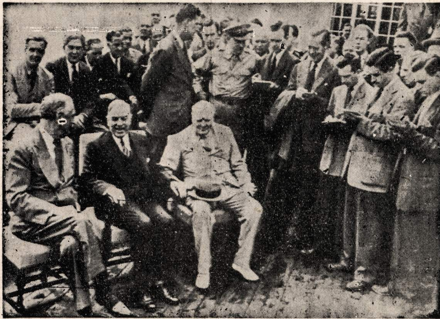
Prezidentas Rooseveltas, Kanados premjeras King ir britų premjeras Churchill priėmė spaudos atstovus, kai buvo baigta Quebeke konferencija. Spaudos atstovus informavo prezidentas, britų premjeras ir McKenzie King.