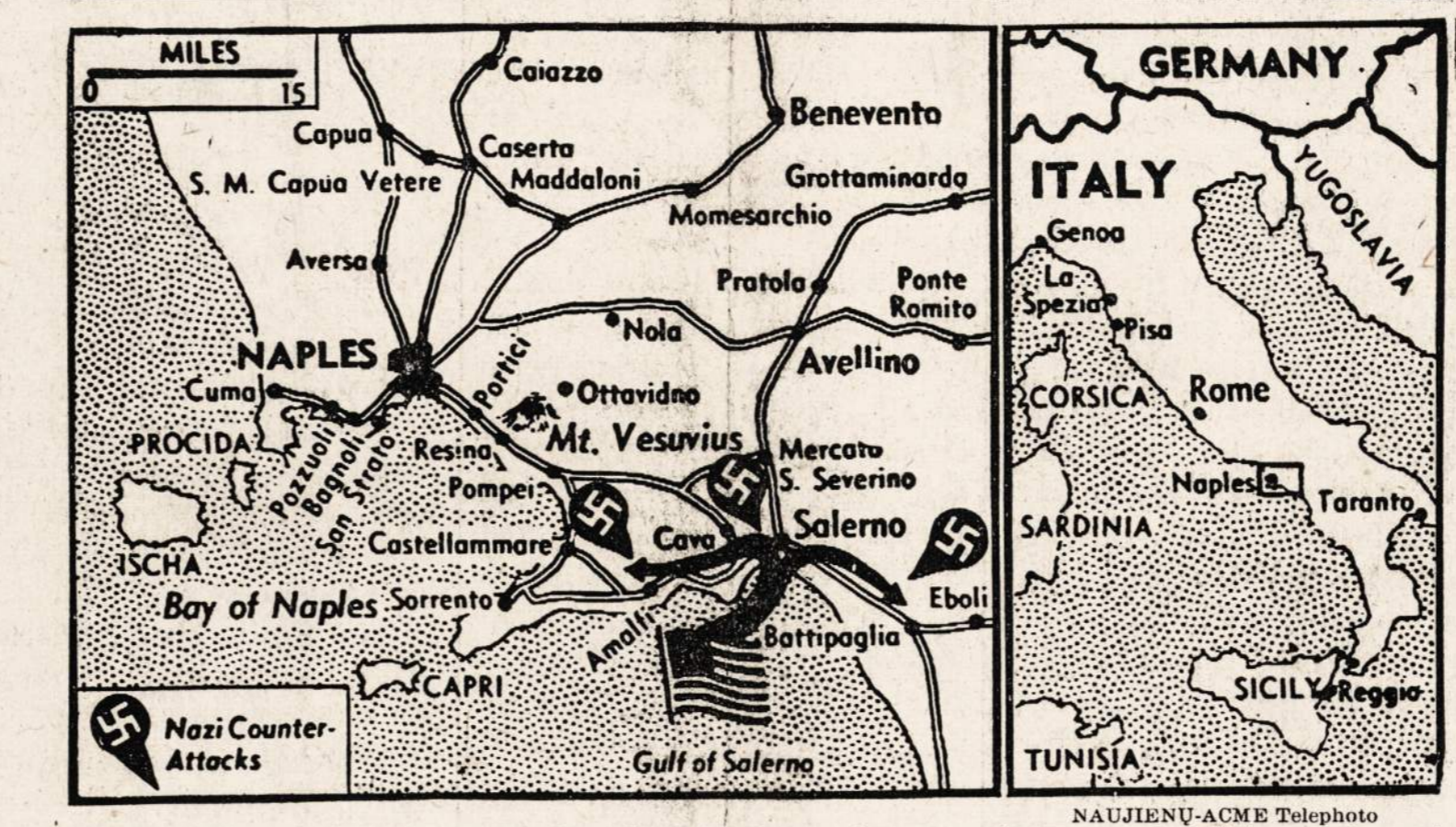
Atkaklios nacių kontr-atakos kai kuriose vietose pajėgė prasimušti per Amerikos 5-sios armijos laikomas pozicijas Salerno srityje. Tačiau labai smargūs mušiai tebesitęsia, ir kieno bus pergalė,—sunku pasakyti.