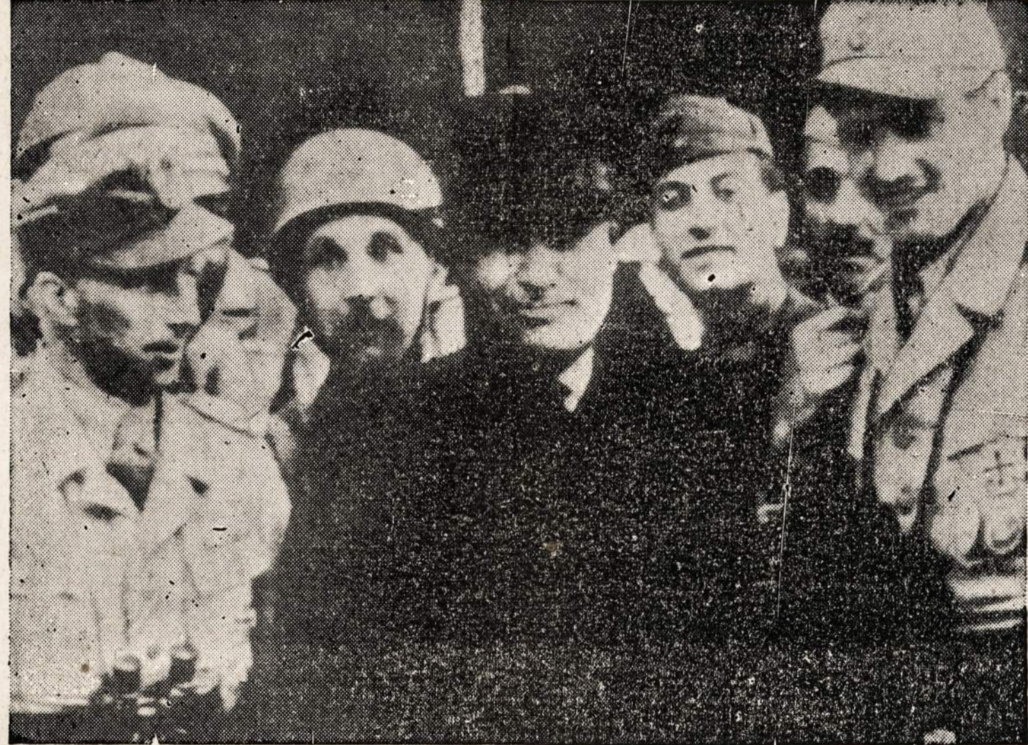
Benito Mussolini su vokiečių paraštininkais, kurie jį išlaisvino iš mažo Gran Sasso (į šiaurės nuo Romos) viešbučio. Buvęs arogantiškas diktatorius vos tik šypsosi,—nebėra to pasipatimo, kuriuo jis ypač pasižymėdavo.