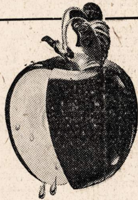
PADARO DIDELĮ SKIRTUMĄ TABAKAMS.

Apšlakstytas ant Old Gold's rinktinio mišinio tabakų —įskaitant puikų Latakia — iki kiekvienas siutelis sudrėksta. Obuolių "Medus" apgina juos nuo sudžiuvimo, apsaugoja natūralų drėgnumą, kuris yra svarbus skoniu ir šviežumui.