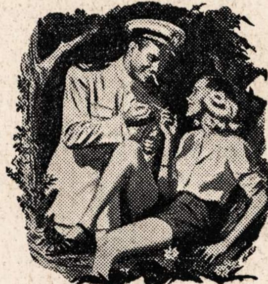
PADARO DIDELĮ SKIRTUMĄ JUMS

Apšlakstytas ant Old Gold's rinktinio mišinio tabakų —įskaitant puikų Latakia — iki kiekvienas siutelis sudrėksta. Obuolių "Medus" apgina juos nuo sudžiuvimo, apsaugoja natūralų drėgnumą, kuris yra svarbus skoniu ir šviežumui.