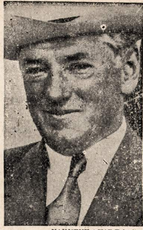
James M. Curley, kongresmanas, buvęs Mass. valstijos gubernatorius ir 3 terminus Bostono mayoras, Washingtono liko apkaltintas raketodarbiavimu su raketeriais, kurie naudojo pašta prigavigiams tikslams.

Mūsų kolonijos lietuviai tik per tokį "aš" nesugebėjo ir neįstengė sukurti ir įsigyti net savo reikalams mažą salelę, kurioje galėtume susieiti, apdarti savo reikalus, gvildinti organizacijų klausimus. Ypačiai dabartiniu laiku daugybė lietuvių kareivių atvyksta į mūsų miestą pirmu kartu iš