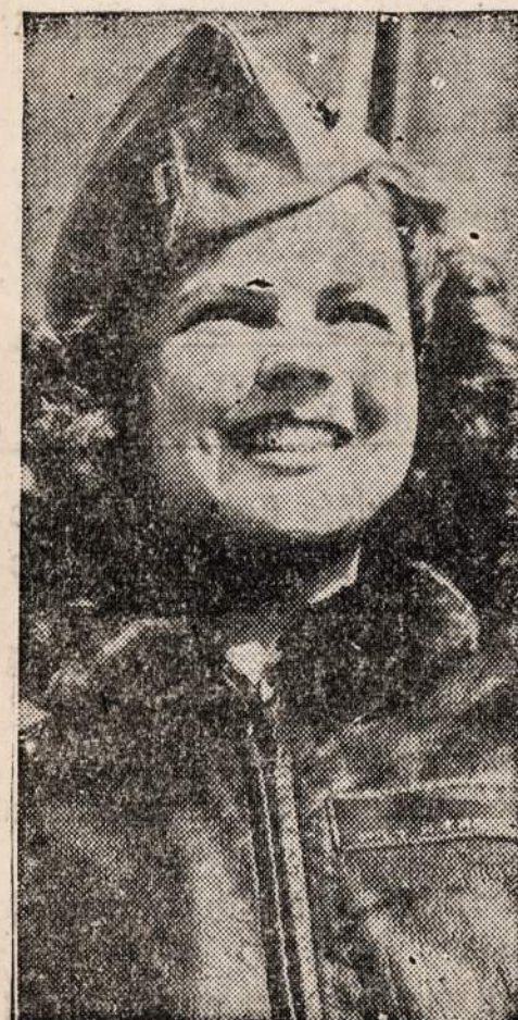
Mariņų korpusas, kuris randasi El Toro, Cal., oficiališkai priėmė Shirley Temple kaipo "Kid Sister".