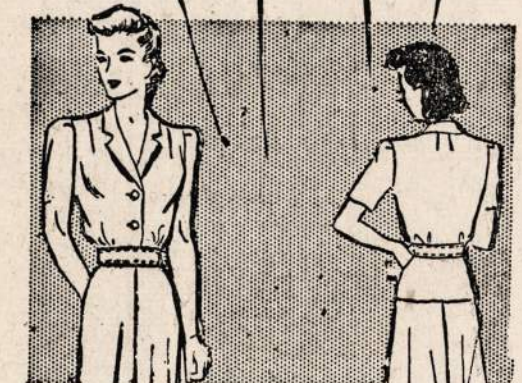
No. 4539 — Praktiška suknelė. Sukirptos mieros 12, 14, 16, 18, 20, 32, 34, 36, 38, 40.

Norint vieną ar daugiau pavyzdžių iškirpti pavyzdį ir numerį, pažymėkit mierą ir aiškiai parašykite savo vardą, pavardę ir adresą. Siųskit pinigų arba pašto ženklėlių kartu su užsakymu. Adresuokit —NAUJIENOS PATTERN DEPT., 1739 So. Halsted St., Chicago, Ill.