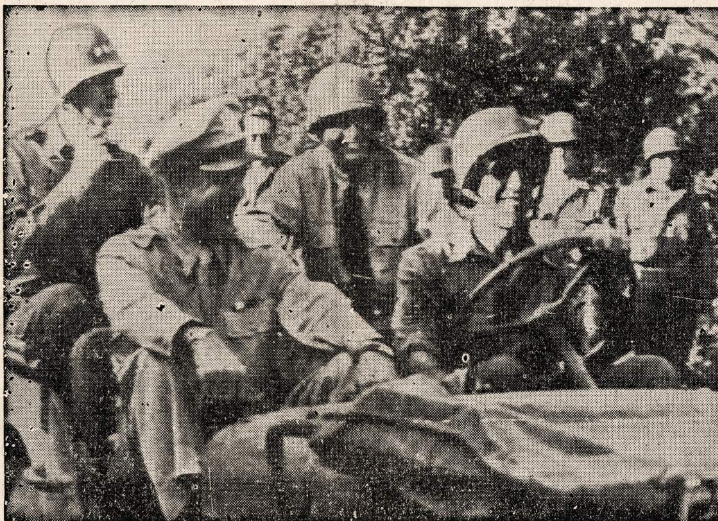
Generolas Dwight Eisenhower, sąjungininkų karo jėgų vyriausias vadovas Šiaurinėje Afrikoje, sėdi karo automobilio priekyje; užpakalyje jo randasi Lt. Gen. Mark Clark Amerikos 5-ios armijos vadovas, ir vice-adm. H. R. Hewitt, Amerikos laivyno Viduržemių juroje vadovas. Jie apžiūri pozicijas Italijoje.