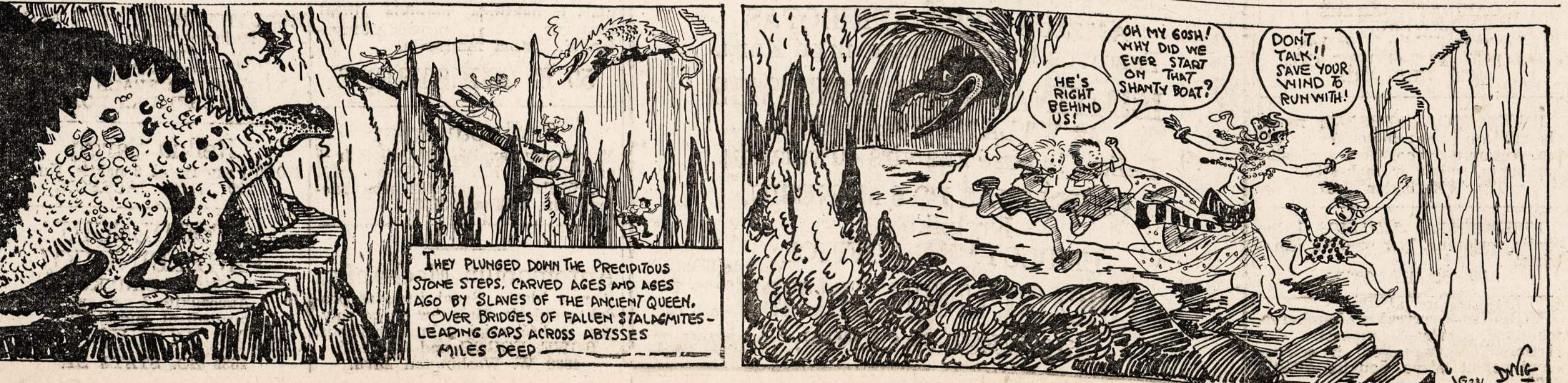
THEY PLUNGED DOWN THE PRECIPITOUS STONE STEPS, CARVED AGES AND AGES AGO BY SLAVES OF THE ANCIENT QUEEN. OVER BRIDGES OF FALLEN STALAGMITES—LEADING GAPS ACROSS ABYSSES MILES DEEP

3325 So. Halsted St. Valandos: nuo 10 iki 2 ir nuo 6 iki 8. Sekmdieniais nuo 10 iki 12. Phone YARDS 7299