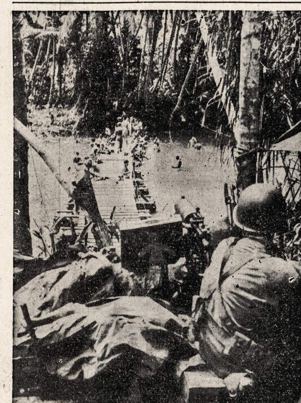
Marinai iš inžinierių batalijono maudosi Pietinio Pacifiko salos upėje, o sargybinis su mašinine patranka žiuri, kad prie priešingo upės kranto neprišluktų japonai.