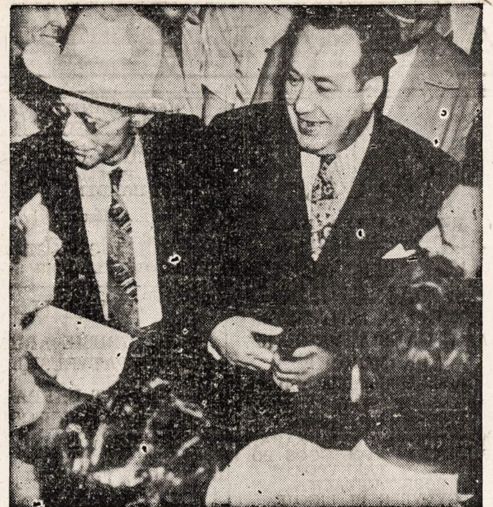
R. J. Thomas (viduryje), CIO vice-prezidentas, liko areštuotas Houston, Tex., kur jis kalbėjo unijos susirinkime. Jis liko apkaltintas sulaužymu Texas valstijos įstatymo, kuris nusako, kad darbininkus į unijas organizuoti gali tik tokie asmenys, kurie turi išsiėmę specialų leidimą (laisnį). Thomaso areštavimas sudarys pagrindą bylai, kuri nustatys, ar sakytas Texas valstijos įstatymas yra konstitucinis, ar ne.