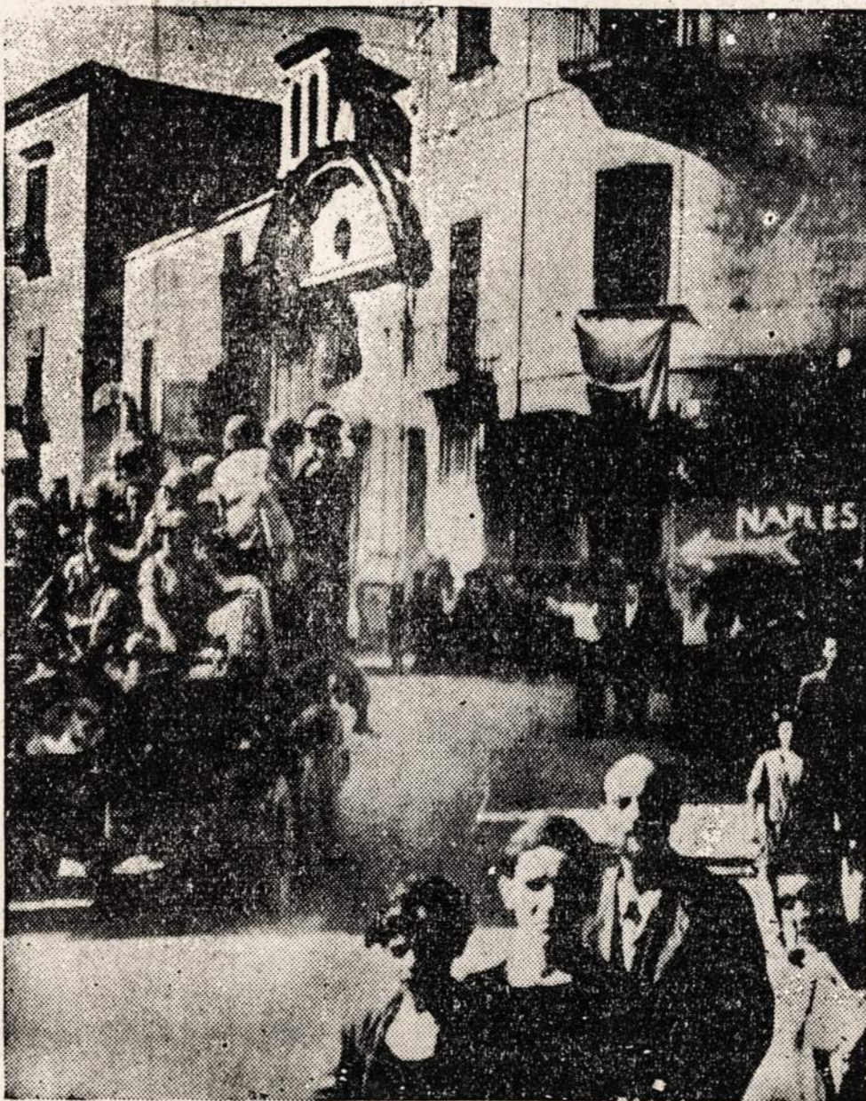
Gen. Mark Clarko 5-ji armija įžengia į Napoli priemiestį tuoj po to, kai iš jos pasitraukė vokiečiai. Besitraukdami iš Napoli, vokiečiai apiplėšė gyventojus ir išsivežė viską, ką tik galėjo išsivežti.