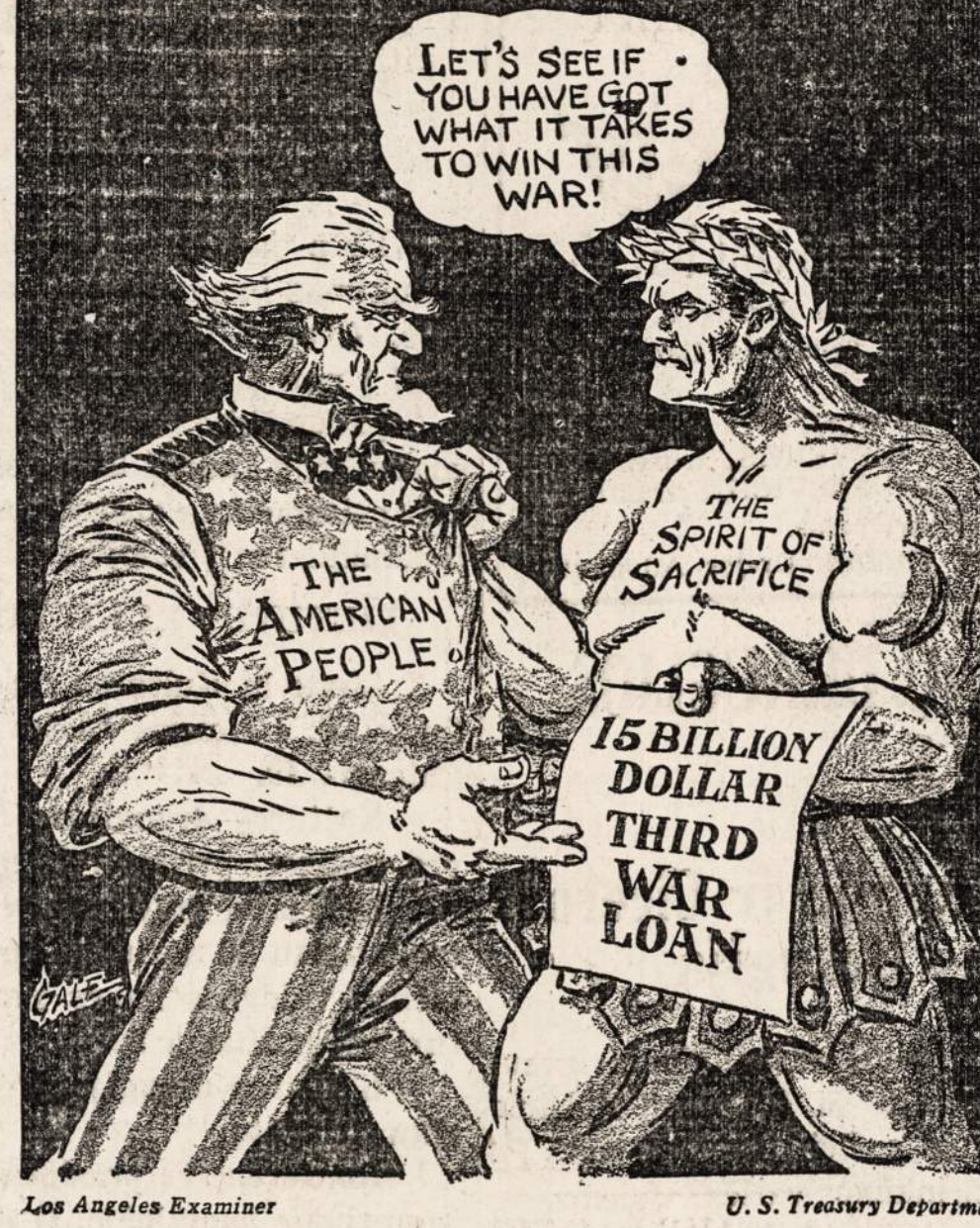
Los Angeles Examiner U. S. Treasury Department